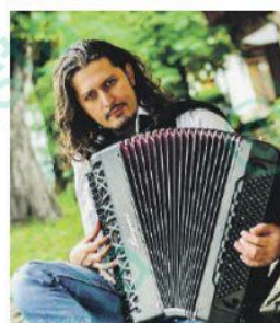
L'altra sera si esibisce Bobby Solo e c'era anche Rod Stewart

Centro studi e documentazione Isole Ponziane, che collabora anche alla serata del 20 dedicata al testo "Liberazione" di Emilio Iodice. Reading letterario con musica per "Mediterraneo Nero" di Gian Luca Campagna il 25 agosto. Serata "Thyrrenus mare nostrum" il 23 agosto, in collaborazione con La Schiocca, associazione per la filigrana ponzese.