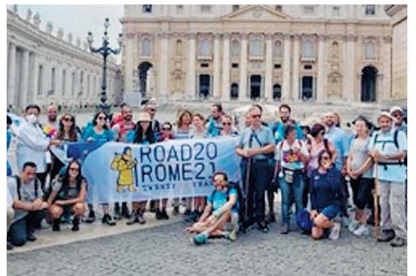
Il gruppo di camminatori della via Francigena

la Via Francigena del Sud che ora è una realtà e con questa iniziativa altamente simbolica intendiamo ricordare il valore del dialogo tra i popoli europei e del mediterraneo e assume un particolare significato inserire Ventotene, isola culla del progetto europeo, su questo cammino». La Via Francigena ha come obiettivo «creare una sinergia tra i paesi dell'Europa: le persone di paesi diversi che la attraversano prendono atto delle caratteristiche dei luoghi come una