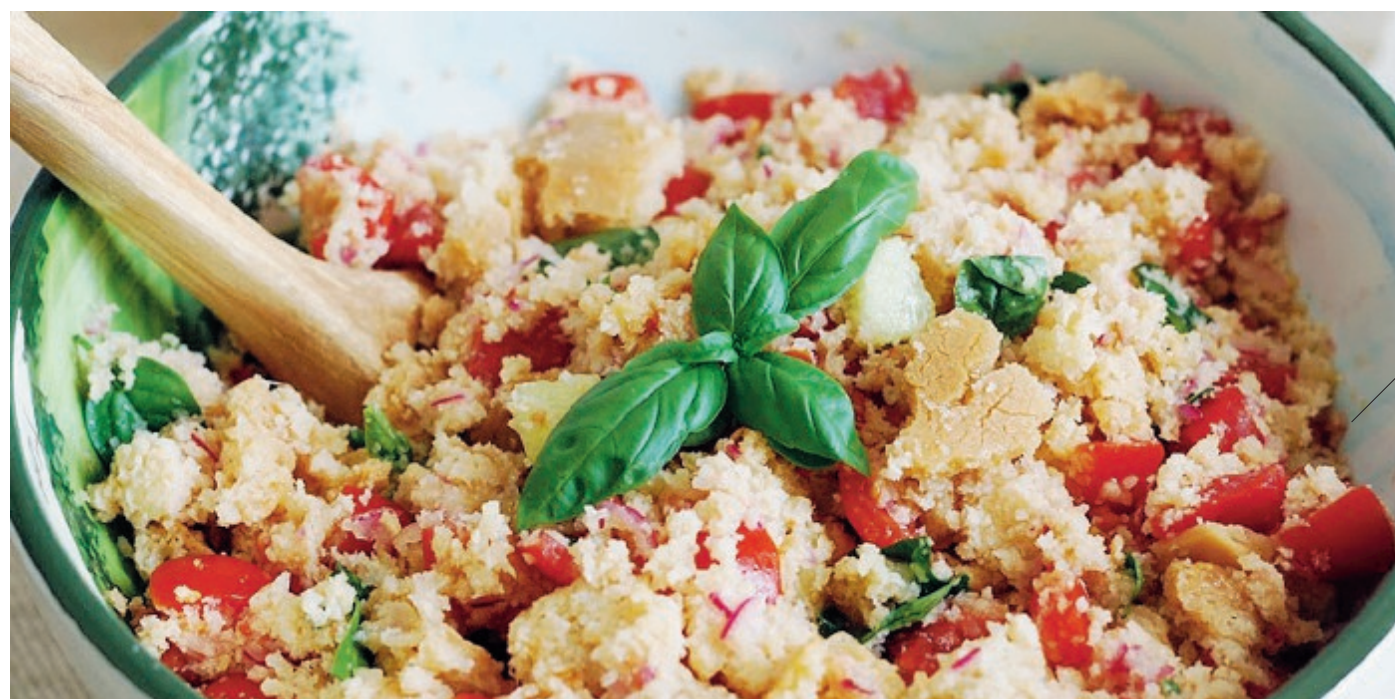
La panzanella toscana è diversa da quella laziale: il pane in ammollo si sbriciola in un'insalatiera. Dopodiché si aggiungono i pomodori tagliati a tocchetti, le cipolle tritate e altri ingredienti

bene e si sbriciola in un'insalatiera piuttosto capiente. Dopodiché, si aggiungono i pomodori tagliati a tocchetti non troppo grossi, le cipolle tritate, il tonno sfaldato, i capperi strizzati, il basilico e il peperoncino. Infine si condisce con abbondante olio extravergine d'oliva, sale e aceto. Prima di essere servita, viene messa in frigorifero per circa un'ora. I toscani usano anche accompagnarla con una frittata di tre uova.