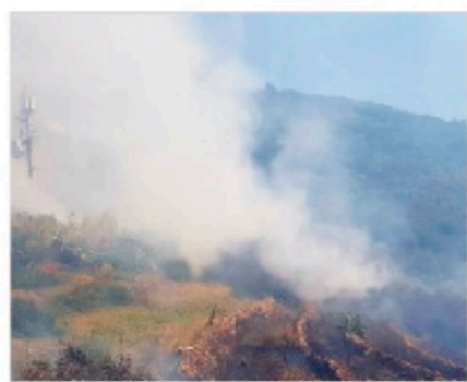
L'incendio in località Campo Inglese a Ponza

Alcune abitazioni invece sono state lambite dall'incendio ma le fiamme sono state contenute grazie all'intervento tempestivo dei volontari. Sul posto sono intervenuti anche i carabinieri che per sicurezza hanno fatto staccare la corrente nella