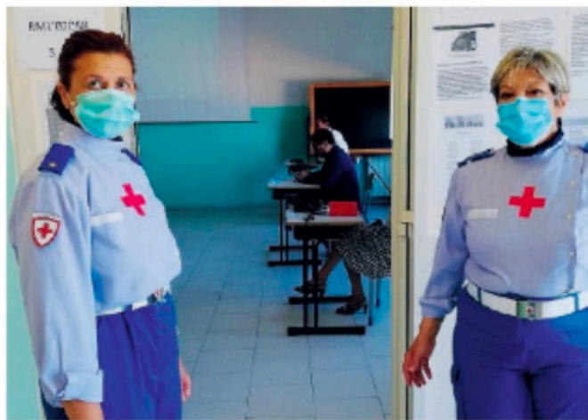
Il personale della Croce Rossa Italiana del comitato di Anzio e Nettuno impegnato nelle scuole del territorio