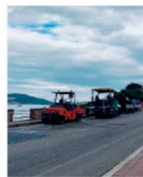
Lavori di bitumazione sul lungomare

«Siamo intervenuti sulle zone più ammalorate della Flaeca di nostra competenza»