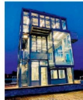
La nuova torretta alla Marina Militare

● La nuova torretta è lì, all'interno della Marina Militare, pronta a fare bella mostra di se e a "vestirsi" di internazionale con questa terza prova di Coppa del Mondo in programma nel giugno del prossimo anno. Era pronta anche per la prima prova di Coppa del Mondo che l'emergenza Covid-19 ha purtroppo cancellato, ma ci sarà tempo e modo per ammirarla.