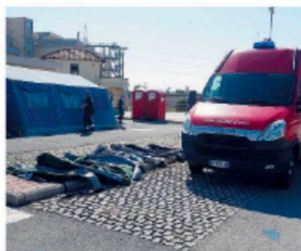
L'arrivo di uomini e mezzi della protezione civile dall'ospedale di Anzio

E ieri, con l'emergenza Covid che sul litorale romano sembra