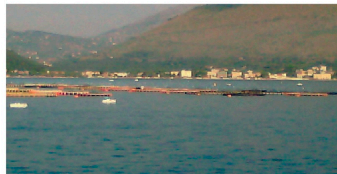
Incontri di lavoro in golfo

Economia Incontro per discutere il progetto del Consorzio Molluschicoltura del Golfo