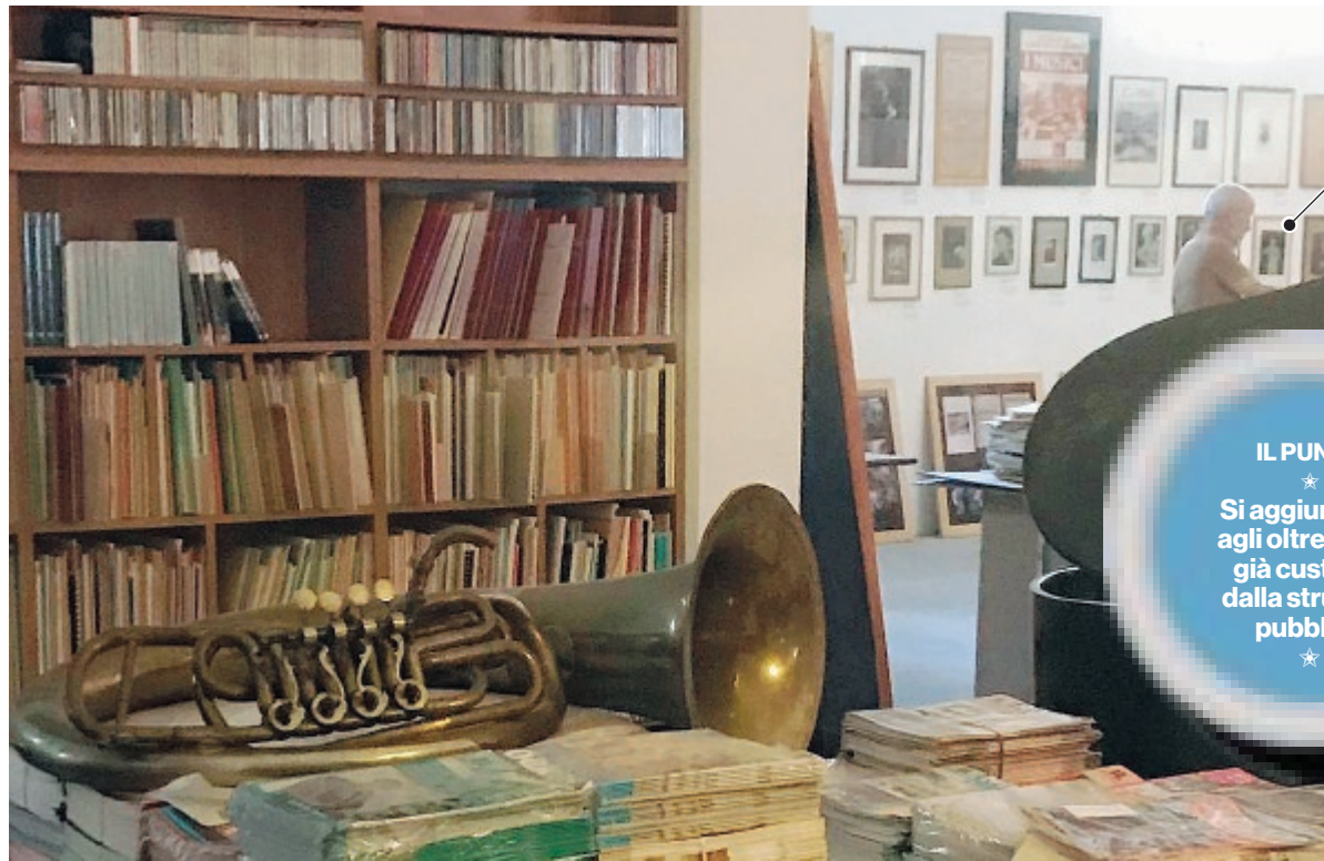
Gli spazi interni del Dizionario della Musica in Italia a Latina

Latina Paradiso: importanti risultati dal lavoro di acquisizione promosso dal Dizionario della Musica in Italia del capoluogo