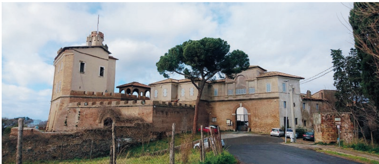
Il Borgo di Pratica di Mare, nel territorio comunale di Pomezia

Le particelle erano state modificate nel 2017. Ora tutto torna come prima