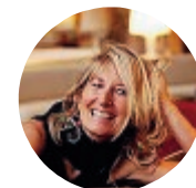
A. Vitale Ajugada Quartet

52nd Jazz Winter Il jazz viaggia senza confini con l'Ajugada Quartet che arriva al secondo appuntamento del Jazz Winter. Dalle 17.30 presso Lavori in Corso (Via Custozza, 2) presenta qui il suo ultimo lavoro "Hand Luggage" disco di grande impatto poetico, un viaggio senza confini né limiti geografici, che supera le frontiere attraverso il jazz inteso come linguaggio universale