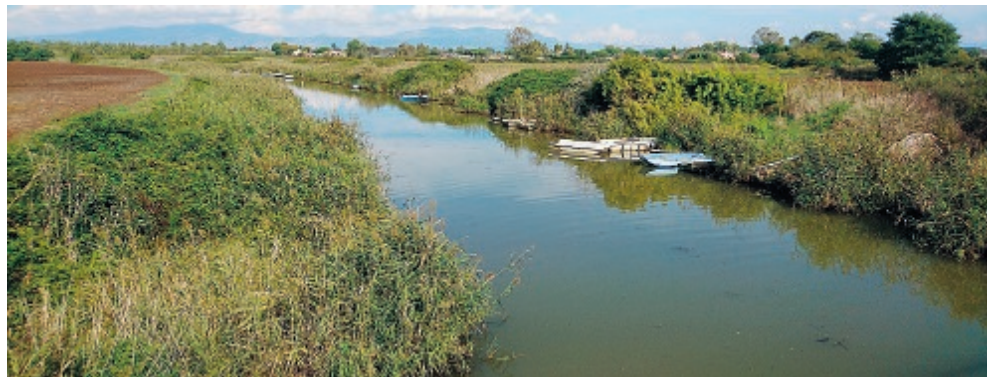
La discarica di Montello come prima causa del forte inquinamento della risorsa

zionano i singoli aspetti del quotidiano, che certe realtà trovano nuova vita». Per quanto riguarda i progetti del Comune, Coletta è stato chiaro: dopo il disastro degli anni '70 e '80 non è più possibile riaprire la quarta discarica più grande di Italia. C'è bisogno di impianti di smaltimento che renda gli enti autosufficienti. ●