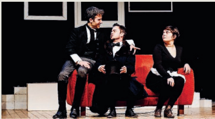
Un momento di scena da "Atti comici"

Raccomandata la prenotazione: 3286115020 oppure 3291099630. ●