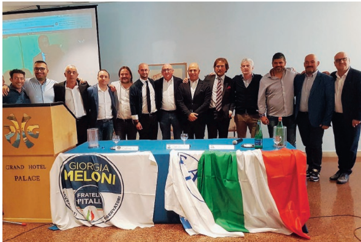
Gli esponenti del centrodestra pontino alla presentazione della manifestazione romana a Terracina domenica scorsa

Forza Italia è disposta a sostenere la sfiducia purché l'atto sia condiviso da tutti