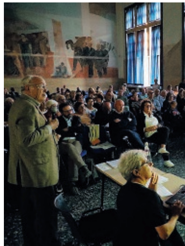
Un momento dell'incontro di ieri