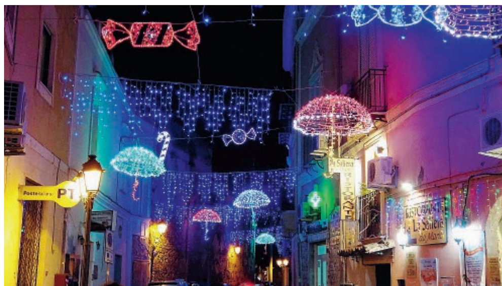
A sinistra e destra alcune immagini con le installazioni delle scorse edizioni

Dopo i saluti istituzionali si è passati alla presentazione delle novità che ci saranno in questa nuova edizione. Oltre a nuovi personaggi luminosi, ci saranno, in diverse parti della città dei video mapping, posizionati nei luoghi più caratteristici di Gaeta come la cattedrale di S. Francesco, piazza Goliarda Sapienza in via indipendenza e altre, in cui verranno video proiettate immagini di un certo spessore artistico, ma soprattutto appartenenti al corredo storico della città. ●