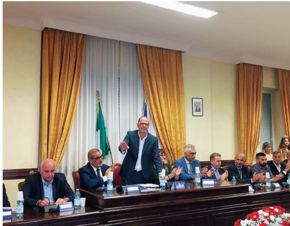
Nella foto a sinistra un momento della presentazione dell'evento Favole di Luce

Il taglio del nastro ci sarà domenica 3 novembre e si chiuderà il 19 gennaio