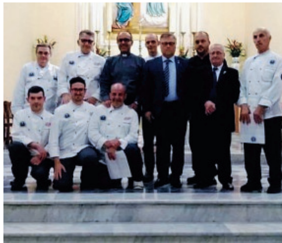
Foto di gruppo nel corso dell'evento ad Itri

Un successo l'iniziativa dei Cuochi del Golfo a "La Valle del Re" di Itri