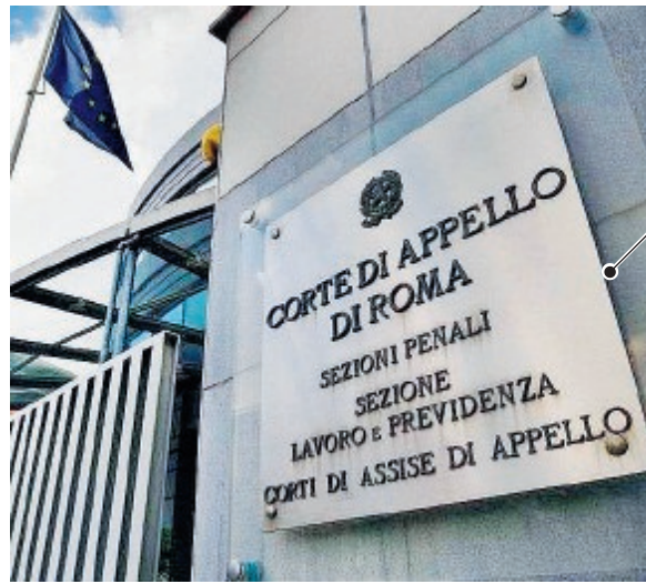
La sede della Corte d'Appello di Roma

«I lavoratori - si legge in una nota - sono stati esposti ad amianto in concentrazione superiore alle 100 fibre per litro nella media delle otto ore lavorative e