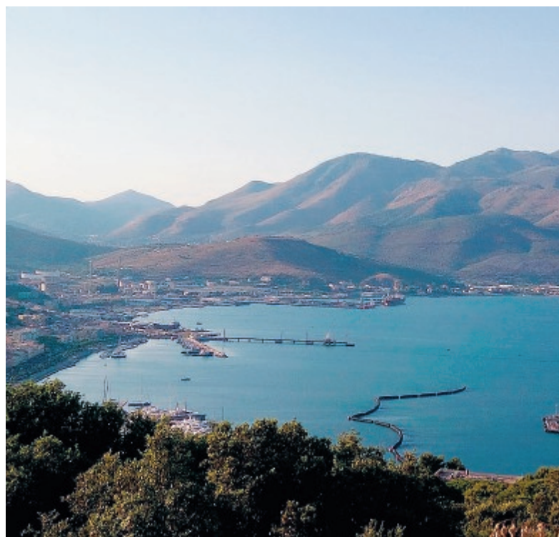
Il golfo di Gaeta