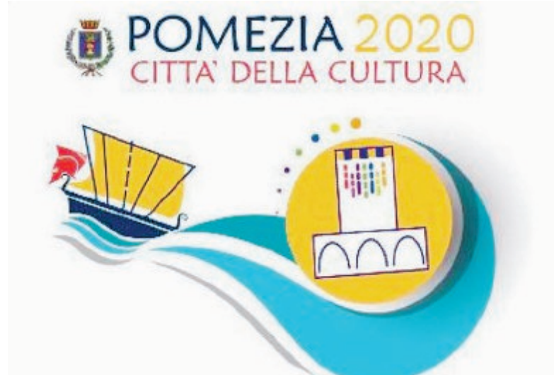
Il logo creato per il progetto

In caso di vittoria la Regione erogherà un finanziamento di 100mila euro