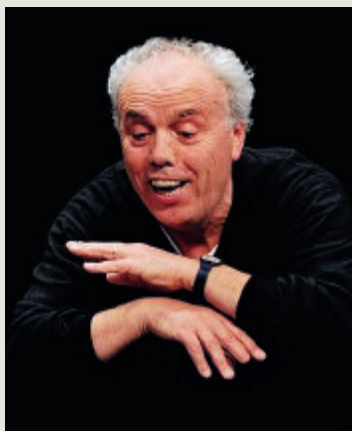
Un momento dal Workshop Teatro "Alcatraz Gubbio"

A 50 anni dal capolavoro di Dario Fo 'Mistero Buffo', che il futuro Premio Nobel presentò in anteprima assoluta il 30 maggio 1969 nell'Aula Magna dell'Università Statale di Milano occupata da oltre 2000 studenti, cambiando da quel momento le regole canoniche del fare teatro in Italia, Roma gli dedica un omaggio con alcuni validi artisti che da anni seguono le orme. La minirassegna 'Roma per Fo' ha avuto inizio con il bravissimo Ugo Dighero che al Teatro Brancaccino la scorsa settimana ha interpretato da 'Mistero Buffo' due episodi: 'Il primo miracolo di Gesù bambino' e 'La parpajatopola', connotati da leggerezza, poesia e ritmo incalzante. Si prosegue il 21 ottobre al Teatro Sala Umberto con Mario Pirovano, da anni fedelissimo discepolo e lodato personalmente dal Maestro che, ammirando il suo stile autodidatta, ne ha decantato le qualità istrioniche di artista. Mario Pirovano, rimasto folgorato dal 'Mistero Buffo', ha assi-