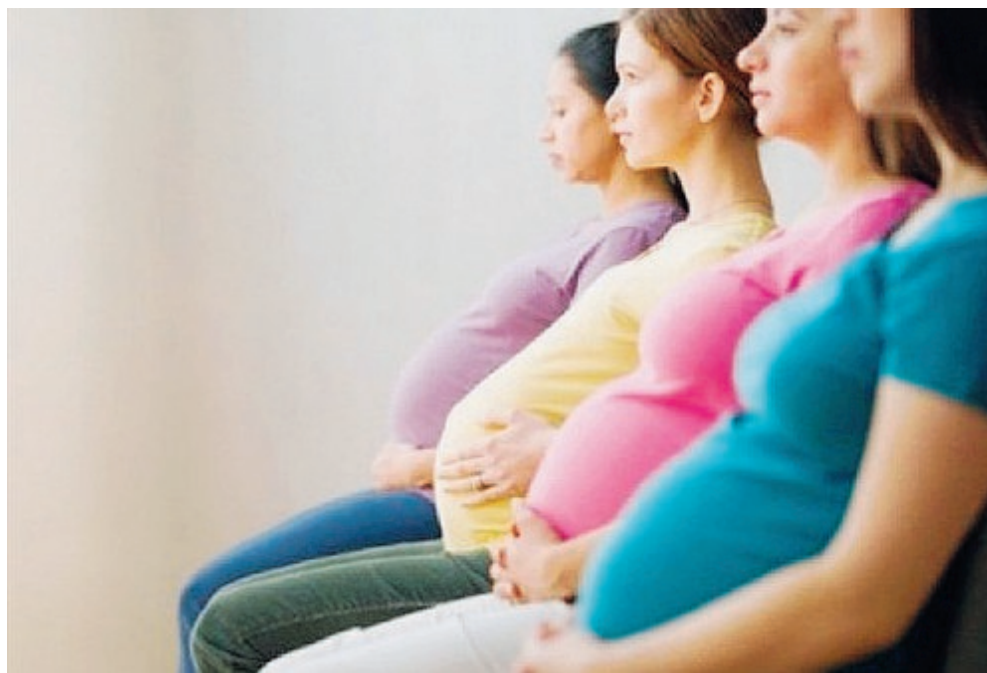
Il trend negativo in tutta la nazione, con il Lazio tra le peggiori regioni in Italia

Nel territorio di Latina, infatti, si è assistito al calo di ben 500 nascite in soli 5 anni. A dirlo è il portale di statistica Open Polis, che fotografa l'andamento della demografia in Italia dal 2013 al 2017 (ultimi dati disponibili). Per essere più precisi, se la provincia di Latina nel 2013 ha regi-