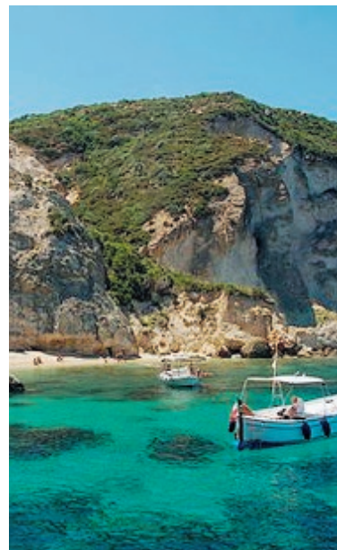
Uno scorcio di Ponza

me a diverse e importanti Associazioni che hanno trattato il tema dell'Europa o che hanno voluto organizzare Convegni e iniziative intestate alla Memoria di italiani importanti costretti al Confino, hanno consentito di predisporre il dossier che ha giustificato il Diploma. «Gli incontri con la comunità che verranno dedicati al tema si svilupperanno a breve - ha detto Santomauro - la prima settimana di settembre, quando ci sarà a Ventotene la 38.ma edizione della formazione federalista organizzata dal Movimento Federalista Europeo e dall'Istituto degli Studi Federalisti Altiero Spinelli, sarà un'occasione di approfondimento del dibattito collettivo anche con tanti ospiti che ci aspettiamo ci raggiungano e primi tra tutti i Comuni insigniti, come Ventotene, del Diploma d'Europa». ●