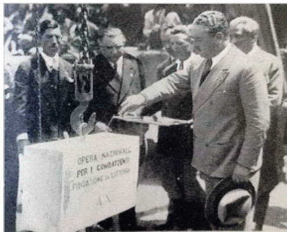
A sinistra il momento della Posa della Prima Pietra a Littoria, a destra una veduta di Latina

■ Sono passati esattamente 87 anni da quando venne posata la prima pietra della città di Littoria dal presidente dell'Opera Nazionale Combattenti, Valentino Orsolini Cencelli e da Alberto De Stefani. Era il 30 giugno 1932, quando fu celebrata la Fondazione della città, sebbene l'allora Capo di Governo Benito Mussolini la inaugurò soltanto sei mesi dopo, il 18 dicembre dello stesso anno, data che ancora oggi viene celebrata come anniversario del capoluogo pontino e che spesso