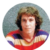
Le musiche di Rino Gaetano al Pizza Village con I Seiottavi

Sagra della Pasta al Torchio Antico Si conclude oggi la settima edizione