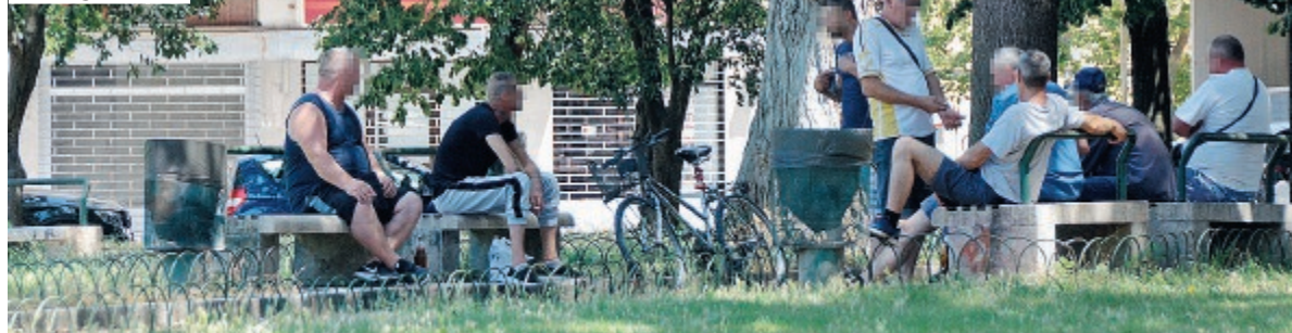
I bivacchi in piazza Santa Maria Goretti, una zona della città abbandonata al degrado ormai da anni