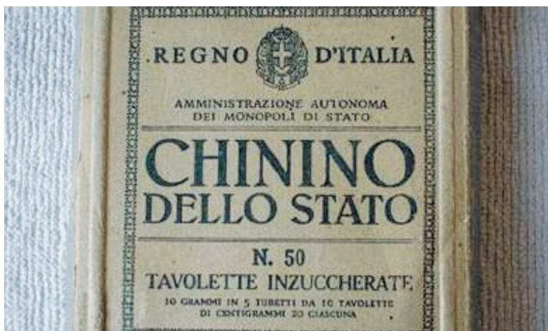
Lo spettacolo sul chinino riguarda un pezzo importante della storia della nostra città