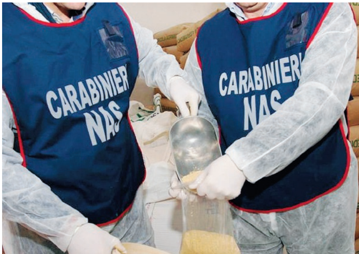
Un controllo dei carabinieri del Nas

Stangate e controlli a tappeto quelli che nei giorni scorsi sono stati effettuati dai Carabinieri del Nas di Latina in tutta la provincia ai furbetti della cucina, e non solo. L'inizio della stagione estiva, infatti, ha visto i militari del Nas di Latina impegnati in attività ispettive che hanno riguardato Night Club, Pub e ritrovi notturni della movida di alcune città della provincia del sud pontino. Controlli che hanno portato alla luce non pochi problemi per alcune attività non proprio in regola, tra cui anche per un ristorante di Gaeta, che a seguito di controlli effettuati dai militari in collaborazione con l'Asl di Latina, ha fatto immediatamente scattare la chiusura del locale per importanti carenze igieniche. I militari hanno quindi fatto luce su alcuni dei locali da Terracina a Gaeta quindi, passando per Fondi, e sono stati effettuati nell'ambito di un recente servizio notturno preordinato, complessivamente 7 controlli che hanno riguardato nello specifico quattro pub, due ristoranti e una rivendita di alimenti etnici. Locali pubblici in cui turisti e cittadini sono abituati a consumare pasti e che si sono rivelati tutt'altro che a cinque stelle. I carabinieri hanno effettuato delle sanzioni amministrative per un ammontare complessivo di 9mila euro; le cause di riscontrate violazioni sarebbero per lo più di natura igienico-sanitaria, di pulizia e manutenzione strutturale dei locali produttivi ispezionati e di mancato rispetto