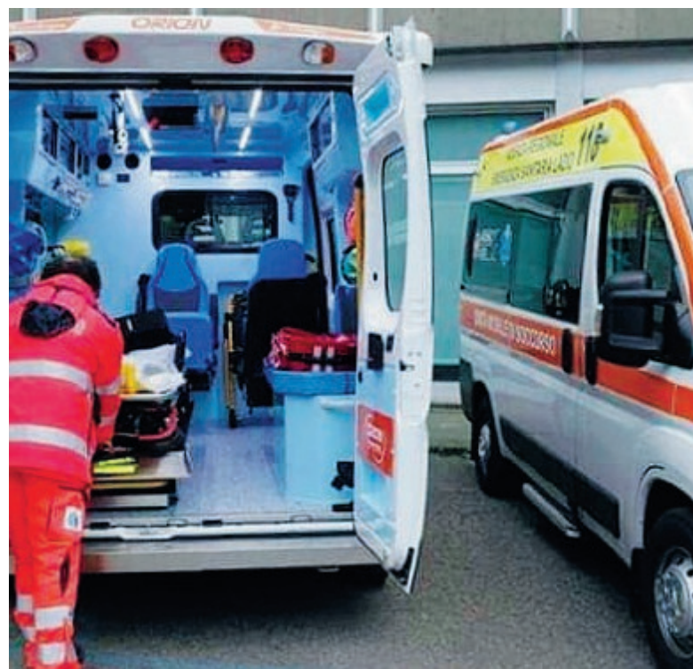
Torna l'attenzione sui punti di primo soccorso

capire quale sia la posizione del ministro Grillo. La difesa dei punti di primo intervento nasce dalla consapevolezza che nel territorio provinciale è indispensabile avere a disposizione questi punti sanitari per garantire un servizio anche in zone collegate male con i presidi ospedalieri più grandi di Latina e Formia. ●