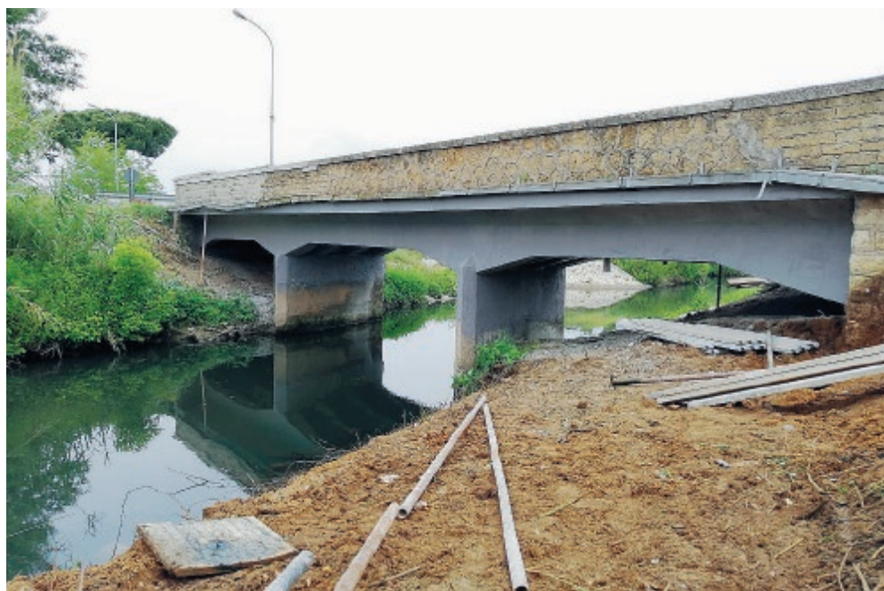
Lavori sul ponte della Litoranea

quando quell'arteria stradale è maggiormente trafficata».