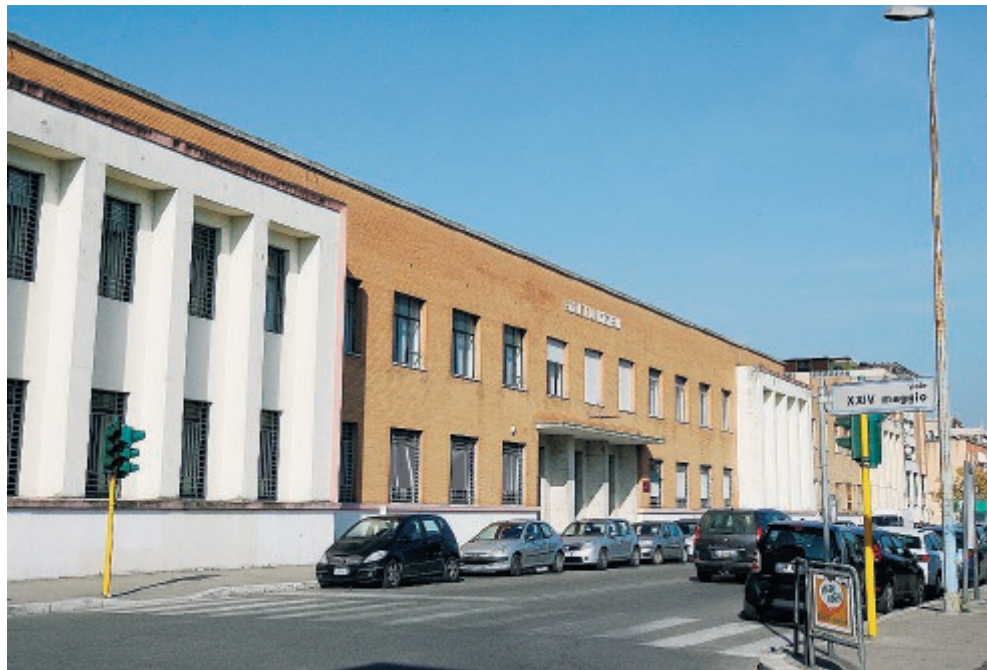
La facoltà di Ingegneria ospita anche le attività del Centro di Ricerca Cersites