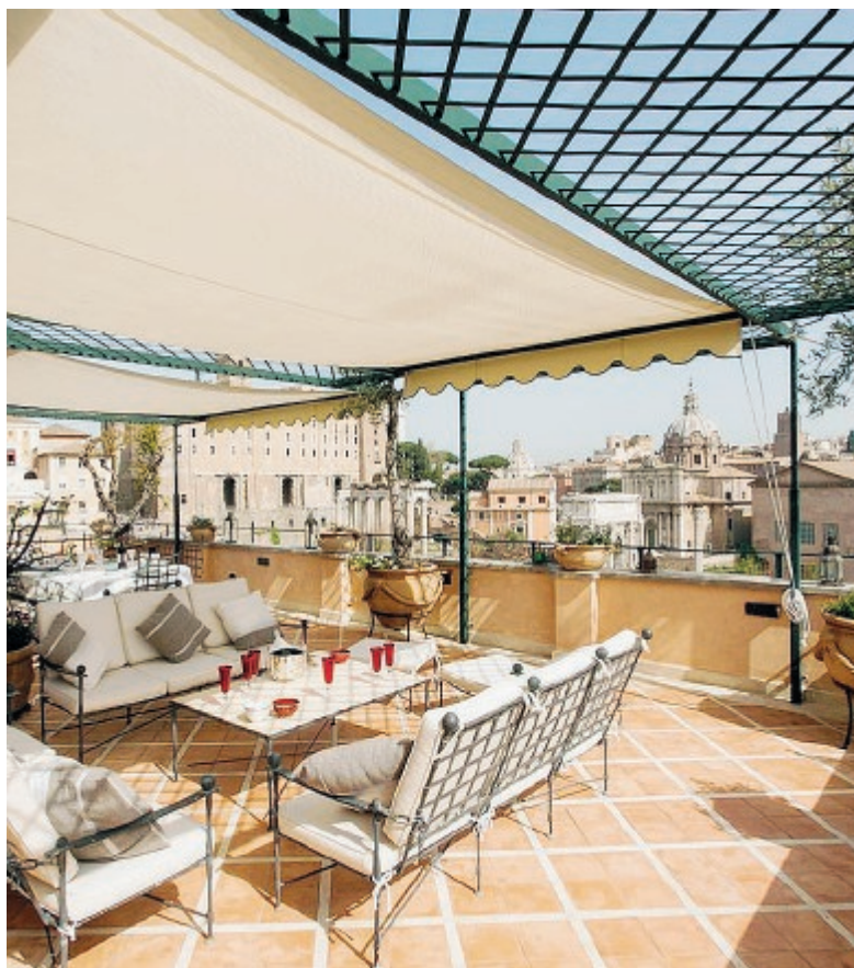
In alto una casa in affitto per le vacanze a Roma; in basso alcuni turisti a Terracina

I turisti "alternativi" sono per la maggior parte giovani: il 40% ha meno di 34 anni, mentre il 25% è composto da adulti tra i 35 e i 44 anni. Le destinazioni preferite dagli "alternativi" sono le località balneari, che registrano il 47% delle preferenze, seguite dalle città d'arte (22%) e dalla montagna (11%). L'appartamento è la tipologia di alloggio più gettonata, scelta dal 52% degli intervistati, seguita dalla casa indipendente o villetta (25%). L'estate è senza dubbio la stagione prediletta, in particolare il periodo giugno-agosto è preferito dal 56%, con un picco ad agosto (25%). Il gruppo di viaggio è formato in media da 3 persone, con la