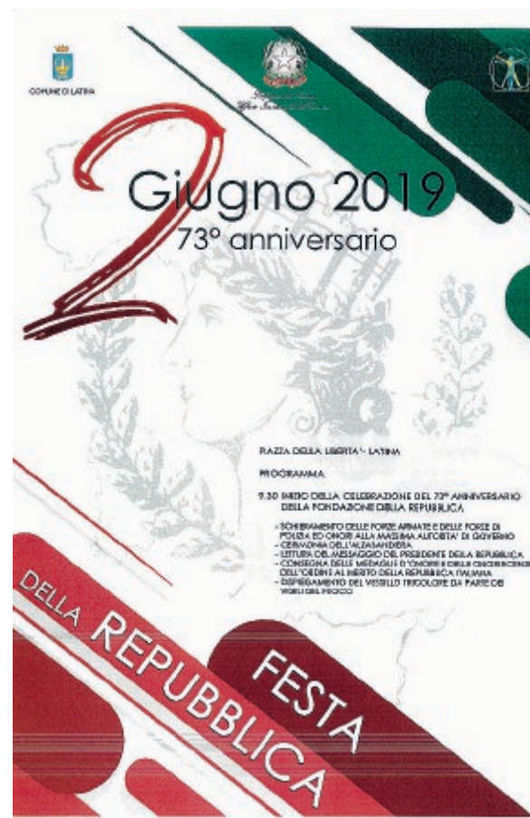
Il manifesto realizzato dagli studenti di Latina

Verranno inoltre consegnati gli attestati di riconoscimento al liceo Artistico e all'istituto comprensivo Volta, per la collaborazione e l'impegno di docenti e ragazzi nel realizzare i manifesti e le cerimonie celebrative delle ricorrenze nazionali organizzate dalla Prefettura stessa.