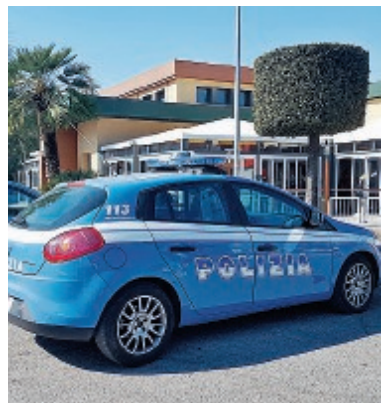
L'operazione della Squadra Mobile della Questura e del Commissariato di Formia

Una complessa attività investigativa che ha permesso di accertare che gli arrestati di ieri furono gli autori di una lunga scia di estorsioni, minacce e pestaggi ai danni del presidente della Cooperativa "Solidarietà Sociale" che all'epoca svolgeva lavori