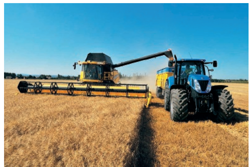
Un campo agricolo del Lazio

pubblici o privati, accreditati dalla Regione Lazio come fornitori di formazione in agricoltura, nel settore forestale e agroalimentare. I destinatari delle azioni formative possono essere gli addetti del settore agricolo alimentare e forestale operanti nel Lazio, i gestori del territorio e gli altri operatori economici delle Pmi che esercitano l'attività nelle aree rurali. Il bando scade il 29 luglio 2019. Per tutti i dettagli: www.lazioeuropa.it .