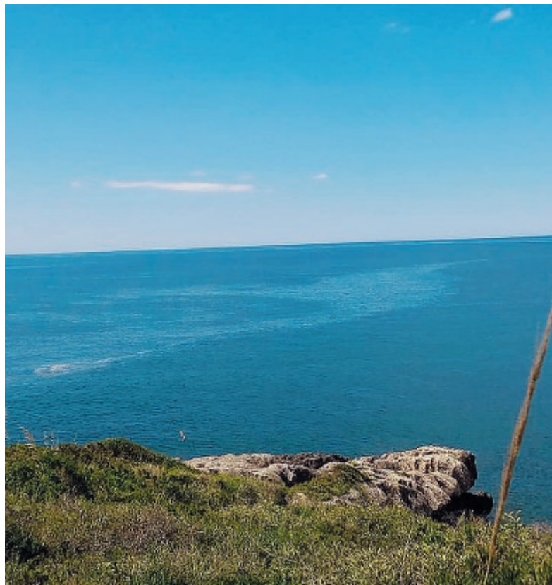
Una scia di schiuma

vocazione turistica. Forse, anzi senza forse, è giunta l'ora che si faccia chiarezza in maniera definitiva su queste schiume, diventate un vero e proprio problema per i bagnanti che frequentano il litorale del Comune di Minturno. Una chiarezza che deve anche portare non solo all'individuazione delle sostanze, ma anche a comprendere perché si verifica questo fenomeno. ●