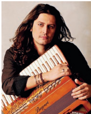
Il Maestro Marco Lo Russo

debuttato in Polonia durante Cracovia Sacra 2017, stasera il Maestro Lo Russo riproporrà l'esecuzione dell'Ave Maria dedicata a Papa Francesco. Il concerto è stato pensato dall'artista come un viaggio musicale, in grado di accompagnare gli ascoltatori nei luoghi della musica classica passando per colonne sonore, world music, composizioni originali e musica sacra.