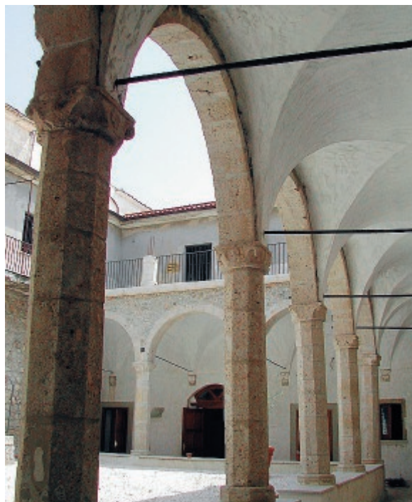
I vertici della Lega a Minturno ed il palazzo comunale