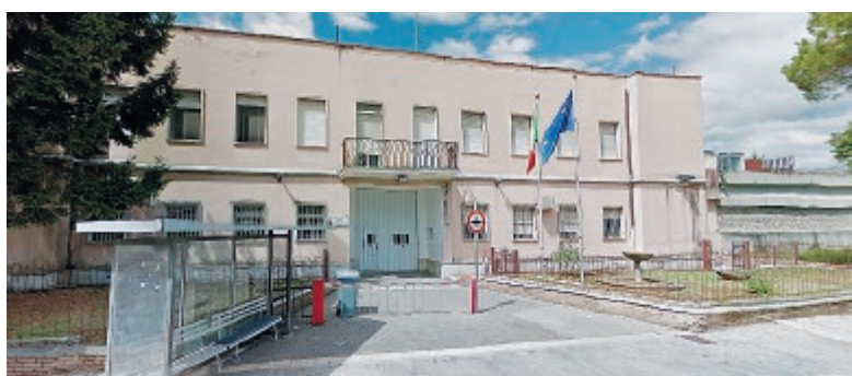
L'ingresso del carcere di Cassino