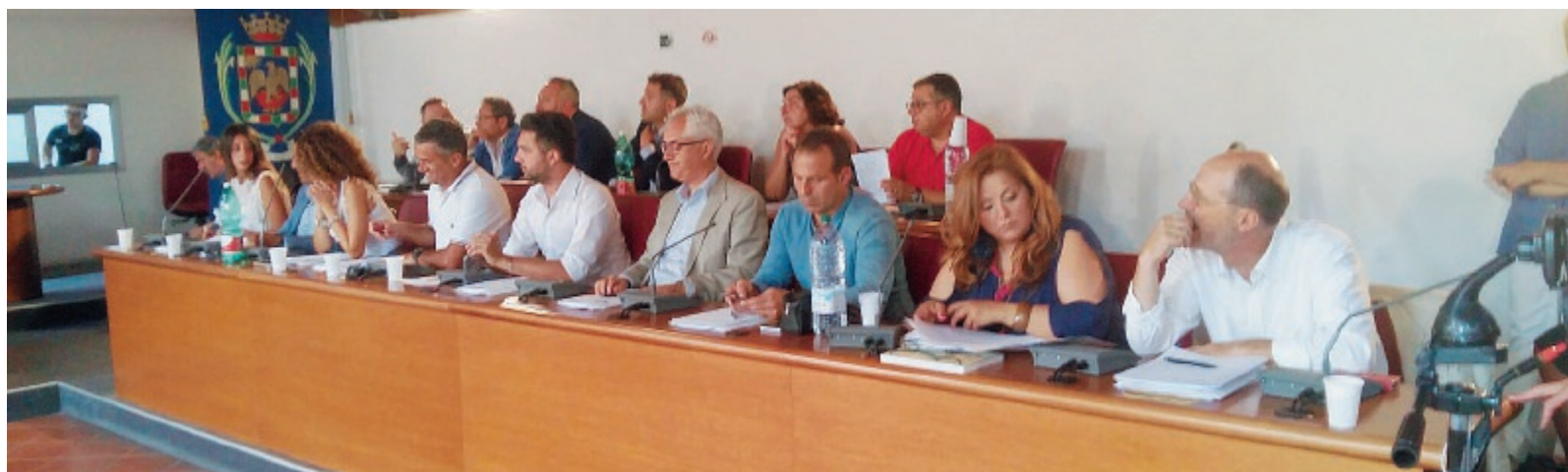
La maggioranza consiliare

Intanto già si pensa all'eventuale sostituto Saranno avviati confronti