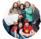
La formazione dei Bandabardò