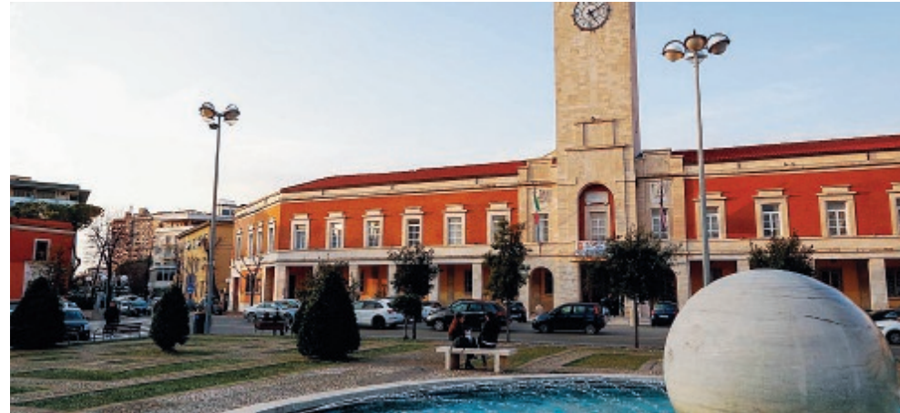
Il Comune di Latina tornerà a votare nel 2021.

Il collante al momento viene garantito dalla opposizione a Coletta