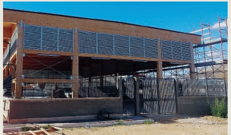
Il mercato del pesce di Gaeta