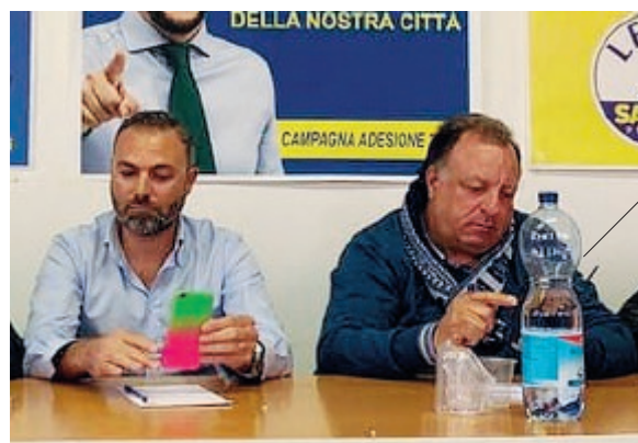
Il gruppo consiliare della Lega