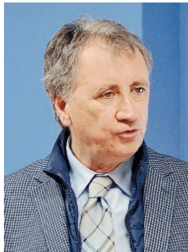
Il senatore Nicola Calandrini (Fdi)