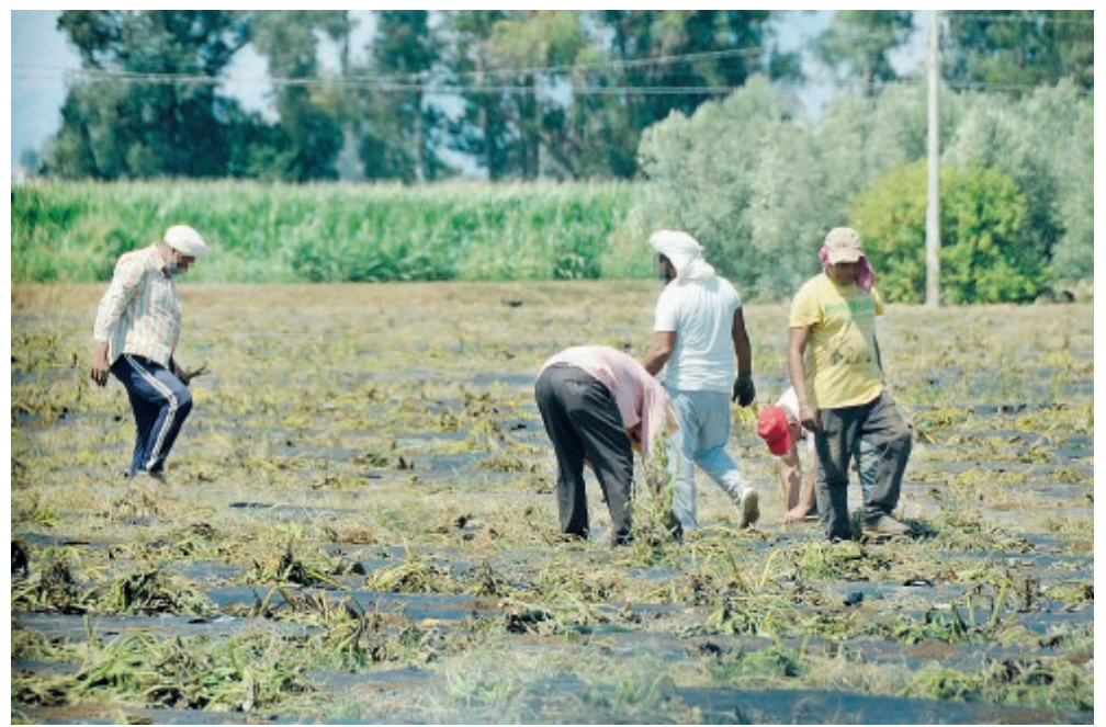
Nella maggior parte dei casi gli stranieri che arrivavano in Italia provenivano dal Bangladesh

Agli atti dell'inchiesta è finita anche una firma su un atto di un notaio