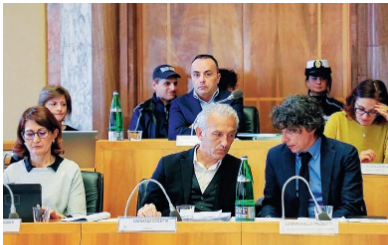
Il tavolo della giunta in Consiglio comunale a Latina

Non c'è dubbio che questo ragionamento attraversi un po' tutti i partiti del centrodestra. Un tacito accordo prima del voto era quello di contarsi, di capi-