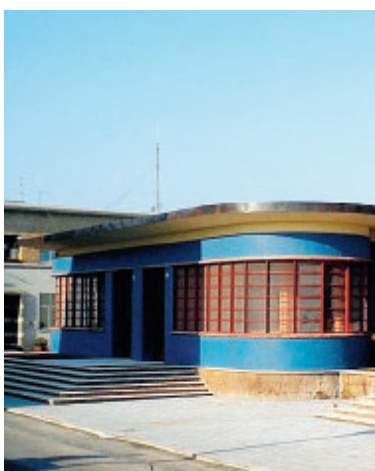
L'ingresso di palazzo Mazzoni

Dopo il convegno sull'era fascista, in questo prossimo even-