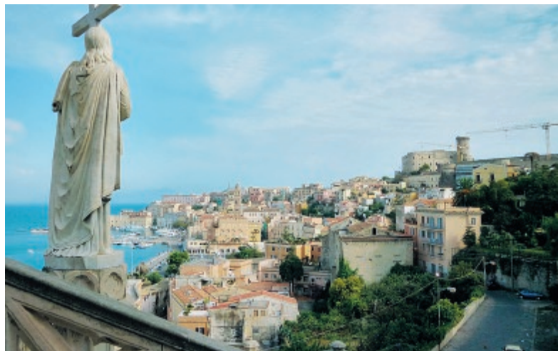
Panoramica di Gaeta

In occasione dei festeggiamenti dei Santi Erasmo e Marciano, patroni della città di Gaeta, è stata emanata un'ordinanza da parte del Comando del Corpo della Polizia Locale inerente ad alcune modifiche riguardo la viabilità e la messa in sicurezza della città di Gaeta. Al fine infatti di assicurare la viabilità al centro storico di Gaeta Sant'Erasmo, è stata in-