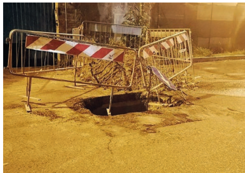
Uno dei cantieri per l'emergenza gas