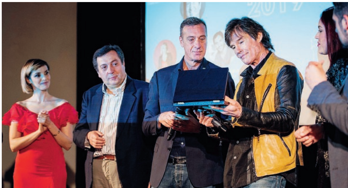
Un momento dell'Ulysses Film Festival