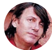
Faber, Fabrizio De André