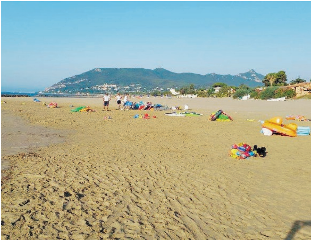
Sopra un tratto di spiaggia di San Felice Circeo, sotto il palazzo comunale