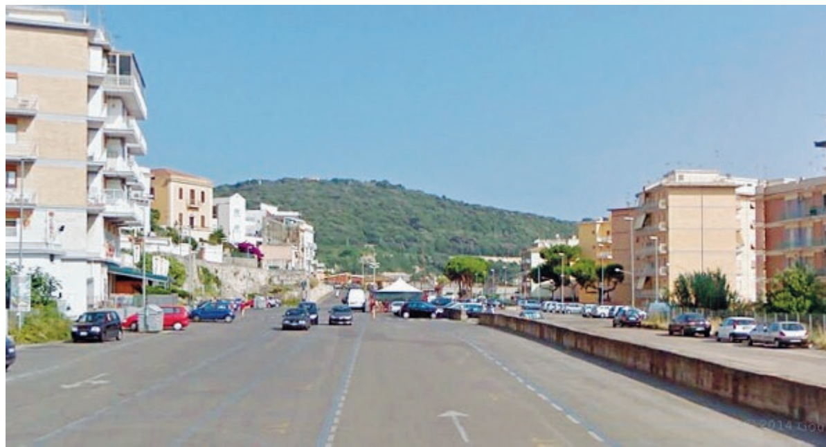
L'ex piazzale della ferrovia di Gaeta

Con il Piano per il Diritto allo studio sono stati programmati gli interventi per garantire, ai bambini ed ai ragazzi che frequentano gli Istituti situati nel territorio comunale, i diritti irrinunciabili di cui agli articoli 3 e 34 della Costituzione Italiana. Il Piano per il Diritto allo Studio abbraccia un anno scolastico, da settembre a giugno, coinvolgendo due bilanci finanziari. «In quanto documento dell'anno scolastico precedente, fotografa lo "stato dell'arte" al momento della stesura, ossia quanto previsto attualmente, rispetto alle priorità rilevate - si legge all'interno del piano - in quanto processo, ha un andamento dinamico e potrà essere integrato e adeguato anche nel corso dell'anno scolastico. Per questo motivo, alcuni progetti, ritenuti strategici nel piano di sviluppo, troveranno attuazione prioritaria, nei limiti delle risorse generali che sarà possibile individuare». ●F.I.