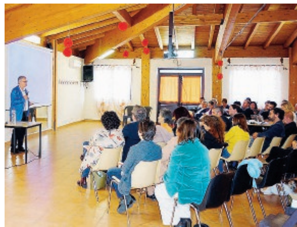
Alcuni momenti della presentazione delle opere d'arte e della passeggiata lungo la via Francigena

L'opera di Francesco Arena mette in relazione due contesti e luoghi storici differenti: da una parte il luogo reale in cui l'opera è installata, la via Francigena meridionale del Lazio creata dal cammino dei pellegrini nel corso di secoli; dall'altra il cammino che centinaia di migliaia di esseri umani compiono oggi in cerca di una vita migliore attraverso il Mediterraneo. Entrambi cammini di ricerca e speranza. L'opera è costituita da