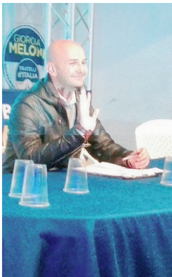
Alcune foto della conferenza stampa di ieri; sopra l'abbraccio tra Nicola Procaccini e il senatore Nicola Calandrini

«Se ho avuto questa affermazione in un collegio di 12 milioni di persone, lo devo soprattutto a voi» ha detto parlando alla città. Orgoglioso dei risultati ottenuti sulla provincia romana, su Frosinone, su Latina e ancor di più su Terracina, dove Fdi è primo partito. In Europa Procaccini andrà ad «affrontare con testardaggine i temi che da sempre mi sono a