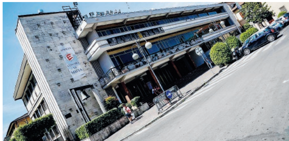
La sede del Comune di Aprilia che deve ancora dotarsi di un qualche regolamento in materia

Per regolamentare e porre precisi vincoli però, l'amministrazione è ancora in ritardo. ●