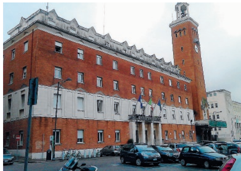
Il comune di Gaeta

anche l'avvio dei lavori di riattivazione ferroviaria, alla luce dei quali si sono stabiliti convenzionalmente punti di accordo per la presentazione del progetto per la realizzazione del parcheggio di interscambio e della stazione ferroviaria e l'uso gratuito del piazzale ex stazione ferroviaria per lo svolgimento del mercato settimanale. È stato stabilito quindi che il Consorzio presenterà entro il 30 maggio il progetto per la realizzazione del parcheggio di interscambio e della stazione ferroviaria, mentre il Comune di Gaeta presenterà specifica documentazione tecnica nella quale saranno evidenziate le aree destinate al mercato e quelle di servizio. Oltretutto il protocollo sarà valido fino al 31 ottobre 2019, in relazione all'avvio dei lavori che interesseranno l'area. ●