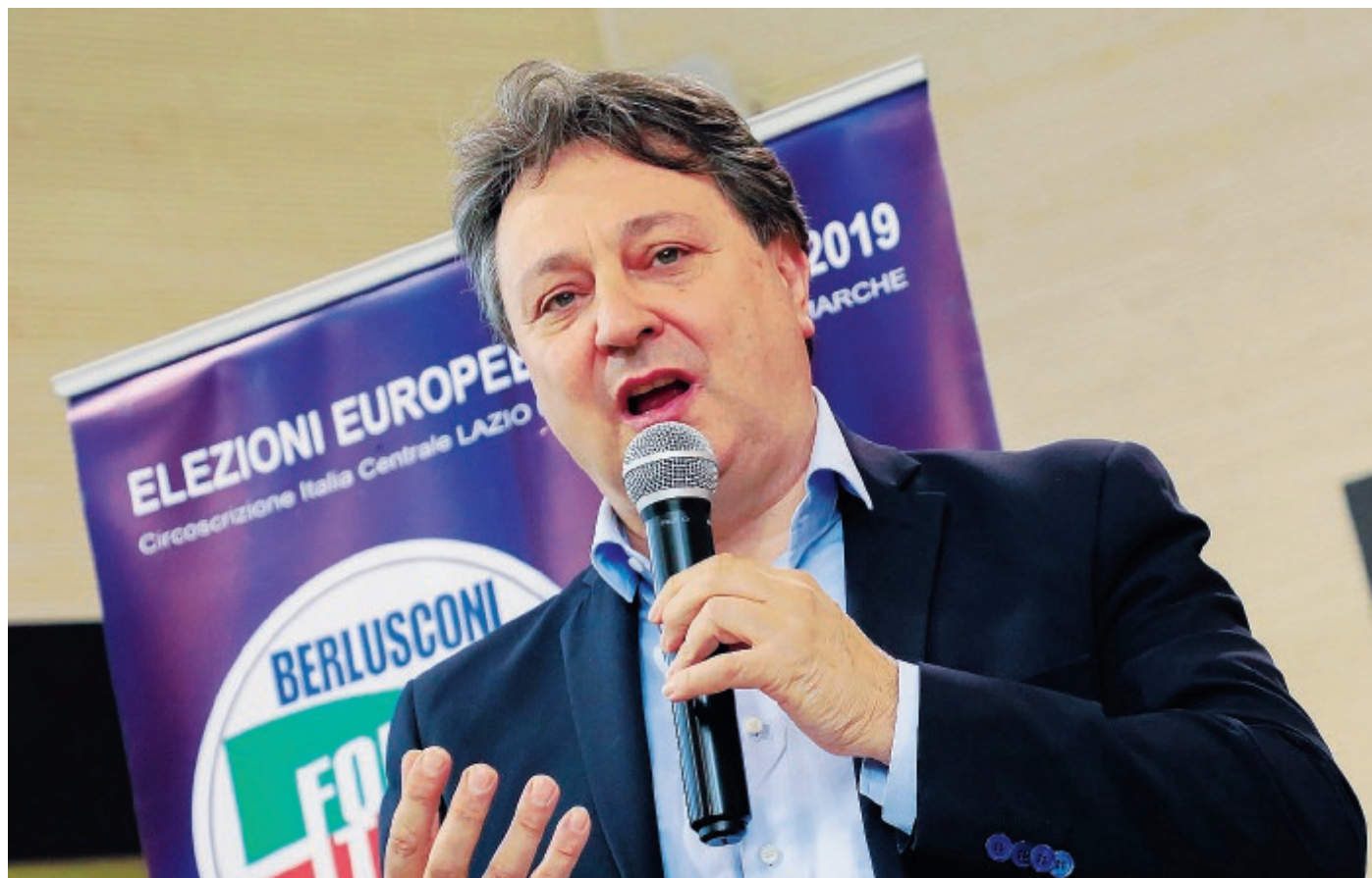
Il senatore e coordinatore regionale di Forza Italia Claudio Fazzone

«Purtroppo devo prendere atto che Forza Italia così non va - continua il senatore Fazzone - Non è più rinviabile la sua riorganizzazione. Bisogna avere il coraggio di procedere ad una svolta chiara e decisa. Forza Italia deve dare spazio ad una nuova classe dirigente che provenga dai territori e sappia incarnarne le esigenze trovando risposte alle troppe criticità che attanagliano le nostre comunità. Il partito non si è saputo rinnovare, conseguentemente non è stato capace di fare un'attenta analisi al proprio interno e domandarsi perché c'è stata una perdita di consensi». Poi le accuse più pesanti. «Il partito è rimasto ancorato alle decisioni di alcune persone, che nulla hanno a che fare con la politica e mai si sono calate nelle difficoltà