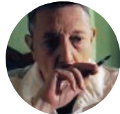
L'attore Sandro Lombardi