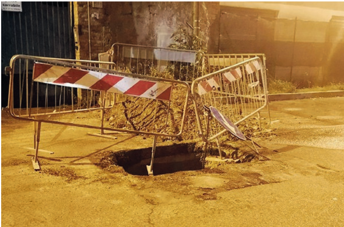
Uno dei cantieri per ripristinare il servizio

■ L'avviso da parte del Comune è stato diramato sabato nel primo pomeriggio. «A causa dell'invasione idrica all'interno delle tubature del gas, è attualmente interrotta la fornitura di gas nelle seguenti aree: via Pietra Composta, parte del quartiere di Castellone, zona San Remigio, via Tonetti, via Porto Caposele, via Giuseppe Paone, via Vindicio, via Olivella. Le squadre dell'Italgas sono già a lavoro, per ripristinare il servizio», è stato il contenuto della nota. E così che la cittadinanza ha atteso sabato e domenica mattina il ripristino del servizio. Ed invece in alcune zone ancora ieri mattina il problema è rimasto, tanto che è esplosa la rabbia soprattutto sui social, soprattutto per chi ha in casa anziani e bambini. Qualcuno ha chiesto chiarimenti anche all'amministrazione comunale, che sta seguendo la vicenda sin dall'inizio del disservizio. Ieri mattina il Comune ha convocato la società Italgas per conoscere la situazione relativa al disservizio e poi subito informando che «le squadre dell'Italgas sono tuttora a lavoro, le zone che attualmente sono oggetto del disservizio sono Via Tre Pini, Via Olivella, Via Tonetti, Via Porto Caposele e parte di via G. Paone, la zona in prossimità di Via Olivella». E tornando ai dettagli tecnici: «Le problematiche che stanno interessando le condutture del gas