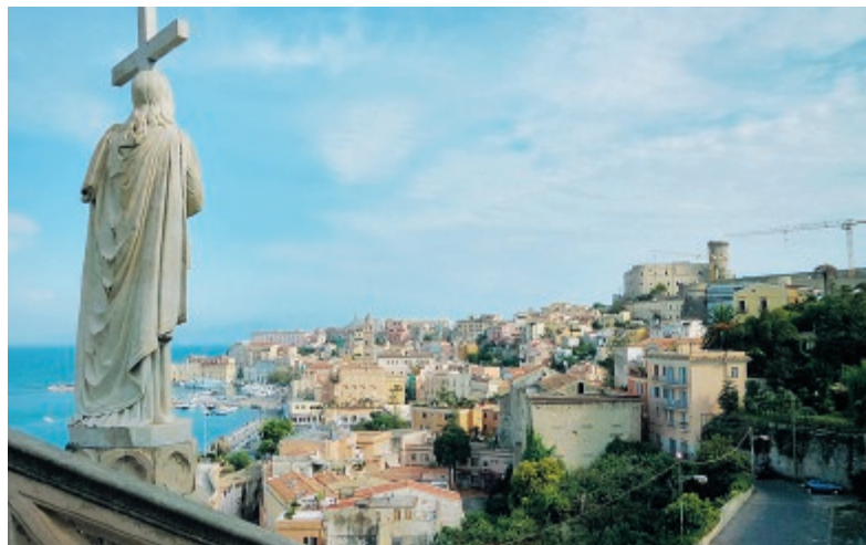
Panoramica di Gaeta

Proseguono le azioni sinergiche messe in campo tra lo sportello di Gaeta della Camera di Commercio e l'Amministrazione comunale. Sulla homepage del sito istituzionale del Comune www.comune.gaeta.lt.it è infatti disponibile un banner, denominato "Gli Sportelli al cittadino", attraverso cui si potrà accedere direttamente al "cassetto digitale" del sito www.impresa.italia.it .