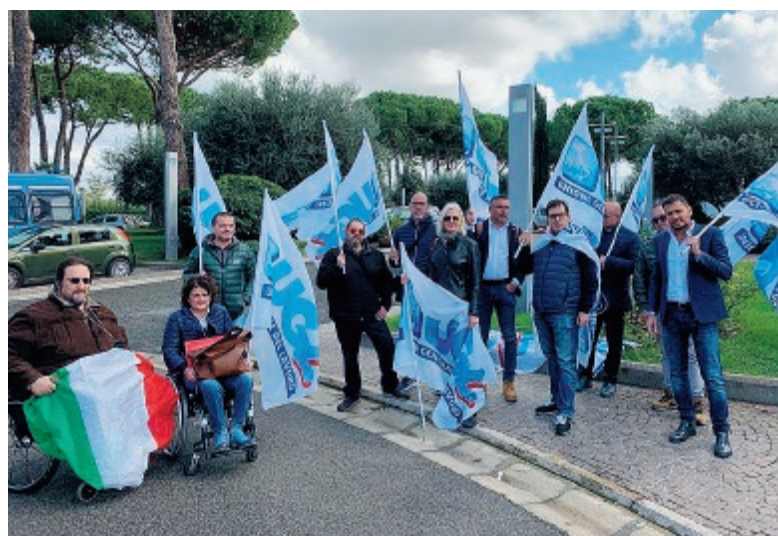
I rappresentanti della Ugl

parte dichiara di voler agire esclusivamente nell'interesse dei lavoratori ma dall'altra fa il contrario e questo non è più tollerabile. Pretendiamo risposte concrete che devono scaturire da tavoli istituzionali e non da riunioni private come accaduto in passato». Inoltre «l'Ugl esprime forte perplessità sulle clausole di salvaguardia per gli operatori e sull'assegnazione alla GPI e alla SDS dei servizi in questione».