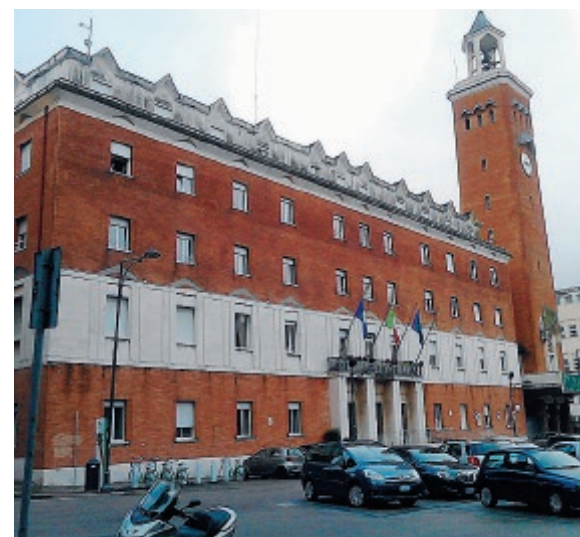
A sinistra il Comune di Gaeta