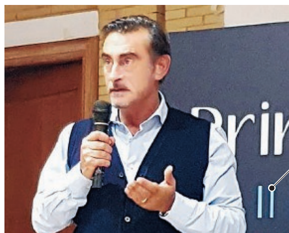
Il deputato di Fratelli d'Italia Marco Silvestroni

Il Governo si impegnerà a valutare l'opportunità di mettere in sicurezza la Pontina, nel presupposto che vengano rinvenute le necessarie risorse finanziarie a copertura degli oneri. Questo è quanto previsto nell'ordine del giorno presentato dal deputato Marco Silvestroni e approvato dalla