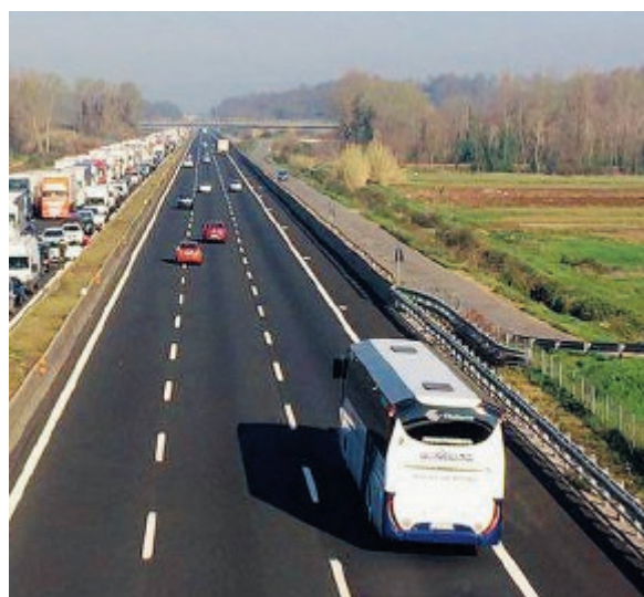
A destra un momento della manifestazione di ieri mattina

Prossimo appuntamento il 15 novembre in concomitanza con il tavolo in Comune