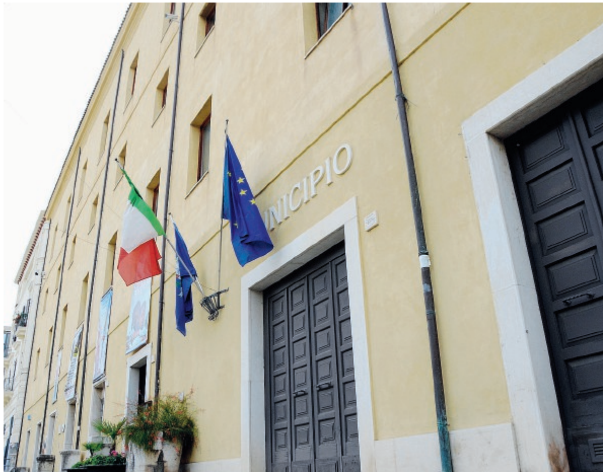
Sopra il comune di Formia; a destra un momento dell'udienza di ieri