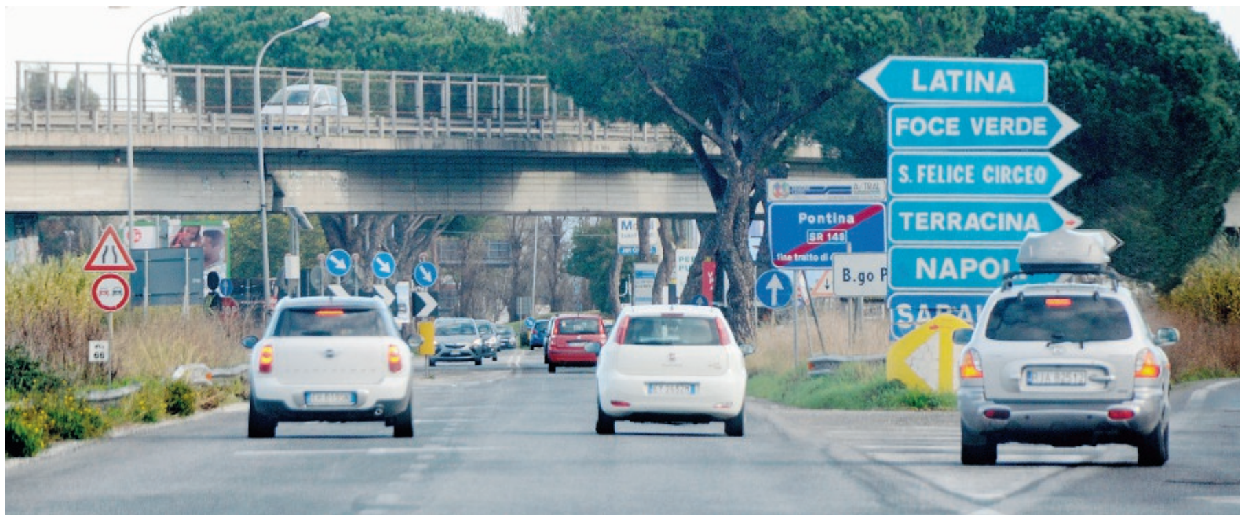
La strada statale Pontina