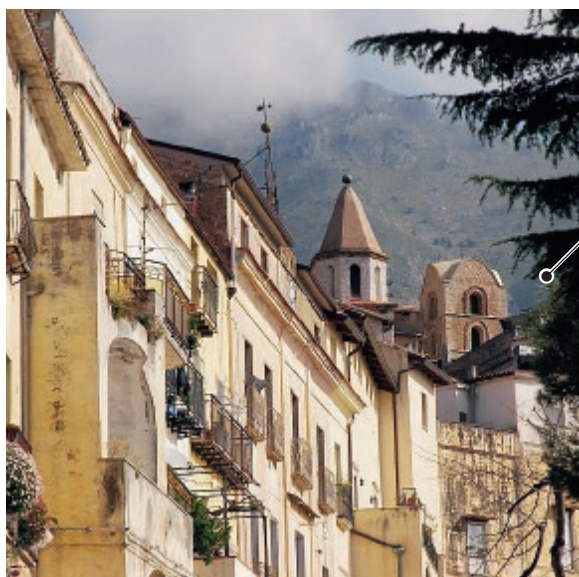
Una scorcia della frazione di Maranola di Formia