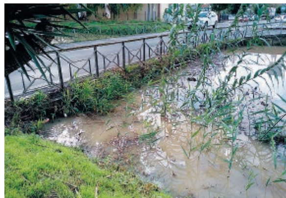
Uno dei canali a rischio esondazione a Pontinia

Per quanto riguarda quest'ultima problematica, diversi sopralluoghi che sono stati effettuati nella giornata di ieri e il Consorzio di Bonifica si è attiva-