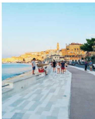
Una veduta di Gaeta

Per consentire lo svolgimento delle riprese cinematografiche del film "Compromessi sposi", in realizzazione in questi giorni nella città di Gaeta, sono state disposte delle modifiche alla viabilità. L'ordinanza, emessa dal Comando Corpo Polizia Locale del Comune di Gaeta, interesserà alcune zone della città nei giorni