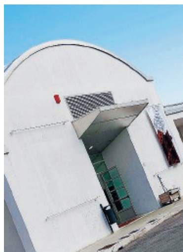
Il Map di Pontinia

Torna il “Diwali”, la festa della luce e della rinascita, che si terrà in piazza Kennedy a Pontinia sabato 10 novembre a partire dalle 18 e 30. A organizzare questa seconda edizione dell'Evento sono il Map, il Museo dell'Agro Pontino, con l'associazione PerCorsi. «Il Diwali - spiegano - è una delle più importanti feste indiane: simboleggia la vittoria del bene sul