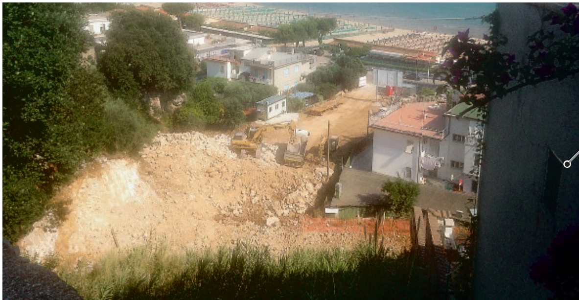
Il cantiere di Fontania sequestrato dai carabinieri; sotto la Procura di Cassino

I reati sarebbero stati commessi nel periodo tra il 2011 e il 2015