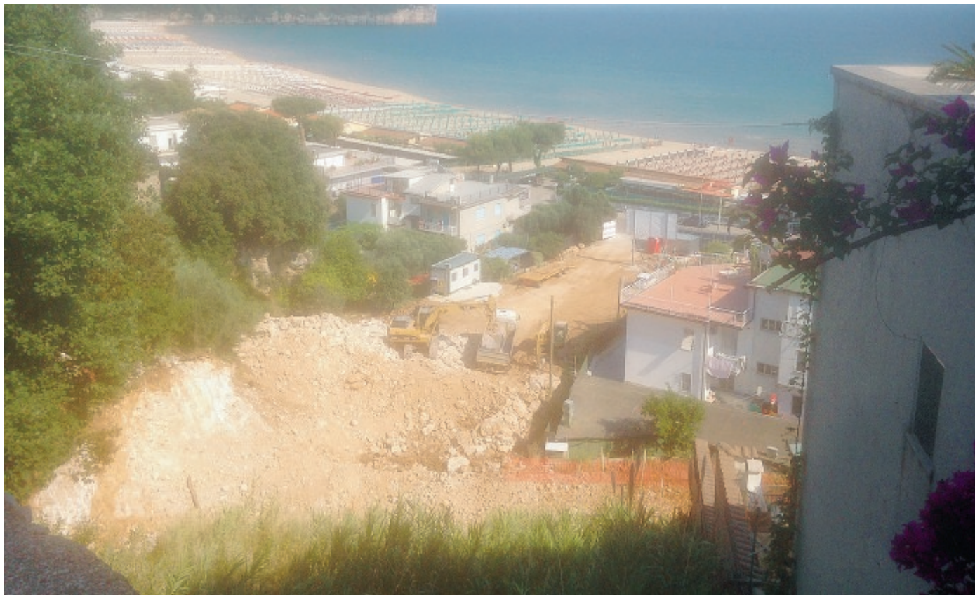
Il cantiere di Fontania; il palazzo comunale di Gaeta

Emerge ancora la questione legata strettamente ad un profilo di anticorruzione. «In un co-