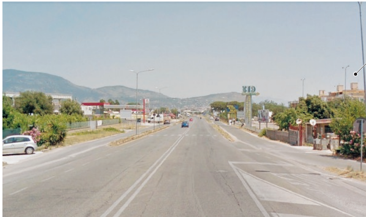
La strada regionale 148 Pontina nel tratto di entrata all'insediamento urbano

L'obiettivo è la messa in sicurezza per l'apertura di nuove attività commerciali