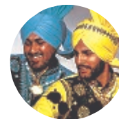
Il collettivo Bhangra Brothers

per le ore 15, presso la sede della scuola in via Mario Siciliano, 4