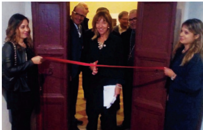
Alcuni momenti dell'evento di ieri pomeriggio