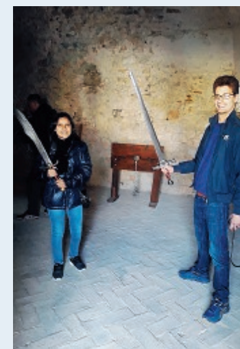
Castellone, stanza delle Torture

Domenica archeologica domani a Formia. Dalle 10,30 alle 12,30 sarà possibile ammirare Caposele, la Torre di Castellone, il Borgo Storico e poi il Cisternone Romano (ingresso a pagamento, 3 euro, solo in questo ultimo caso e solo per gli adulti). La visita guidata in ogni sito dura mediamente 30 minuti. Per dettagli e prenotazioni è possibile chiamare il 349.5328280. WhatsApp 349.5328280.