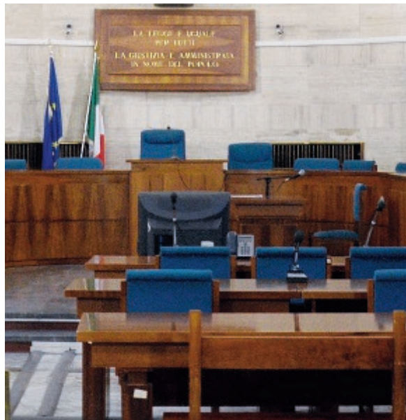
I giudici del Tribunale del Riesame hanno depositato nei giorni scorsi le motivazioni del dispositivo