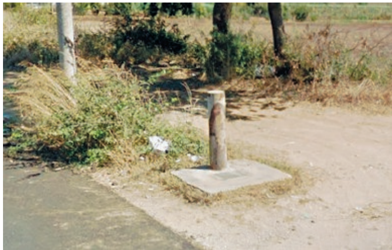
La fontanella che si trova a Sandalo di Levante, periferia di Nettuno

La vicenda, lo ricordiamo, risale al 3 settembre, quando il gestore del servizio idrico comunicò «la difformità dell'acqua distribuita nella zona di Sandalo di Levante, rispetto a quella distribuita dal pubblico acquedotto».