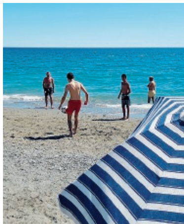
Una partita di calcio in spiaggia

Spiaggiacalcando farà rivivere, per un giorno, un Calcio ormai dimenticato per i giovani d'oggi, riportando lo sport alla sua originaria essenza: gioco, divertimento e soprattutto inte-