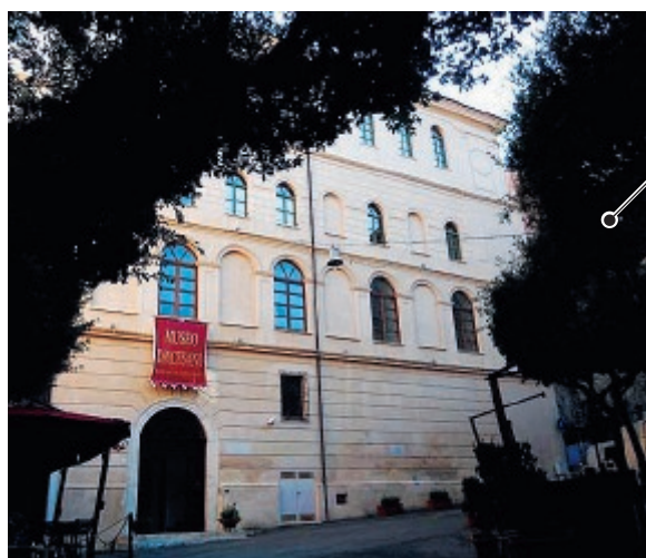
Palazzo "De Vio" a Gaeta

Sono in programma nuove iniziative nei mesi di novembre e dicembre dedicato al Polo Museale e reso possibile dalla sinergia tra l'Ufficio Beni Culturali dell'Arcidiocesi di Gaeta, l'Ipab Santissima Annunziata, la parrocchia della Basilica Cattedrale e l'associazione "Ante Omnia". "Gaeta medievale e la sua cattedrale" è l'appuntamento previsto per venerdì 16 novembre, alle 16, a Palazzo "De Vio"; a seguire, venerdì 23 novembre, alle 17.30, sarà la volta della presentazione di due libri dedicati alla Grande Guerra: "I ragazzi del