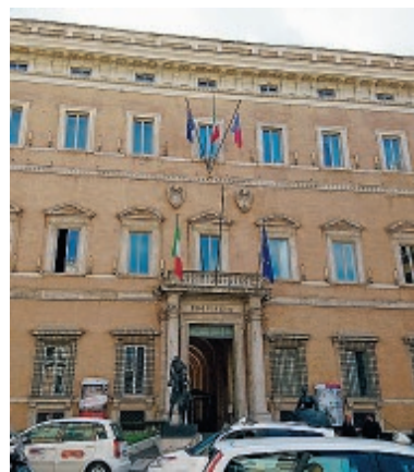
La sede della Città Metropolitana di Roma

Trafelli di Nettuno. Intervento previsto anche all'istituto Colonna - Gatti per cui sono stati stanziati 88mila euro per la sistemazione dei servizi igienici, per quelli tecnologici e per l'eliminazione delle