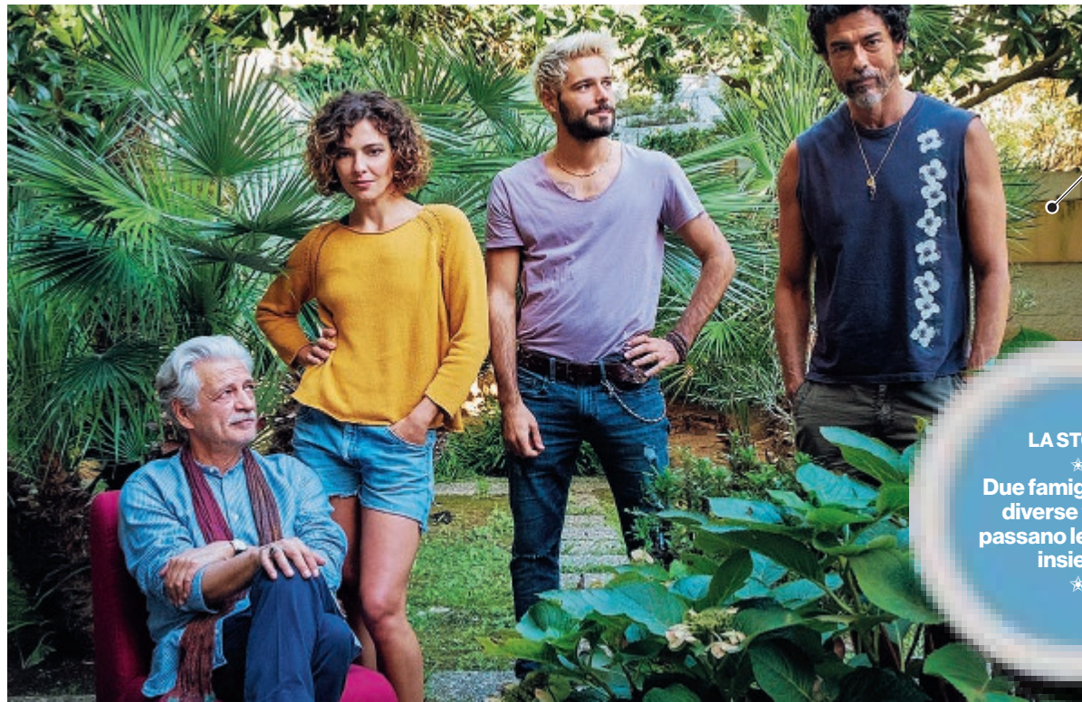
Lo splendido cast del nuovo film di Simone Godano

Cinema Questa mattina tra Largo Paone e il Molo Azzurra di Formia A salire sul set del film di Godano sarà stamani Fabrizio Bentivoglio