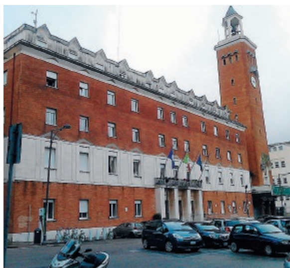
Le richieste edilizie finite nel mirino degli inquirenti sono duecento

mune limitrofo l'organo comunale si sta rivelando fondamentale nelle tempestività, avendo riconosciuto nell'iter giudiziario gli elementi necessari a bloccare i pagamenti di una ditta. Auspichiamo dunque che anche il responsabile anticorruzione del comune oggetto di indagine si attivi nei confronti degli organi preposti».