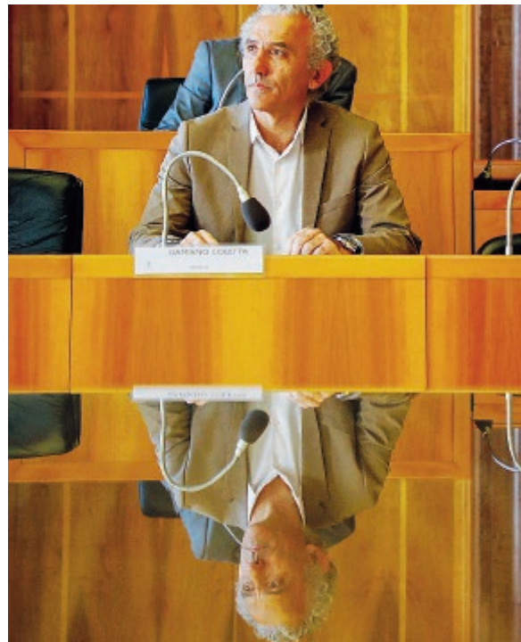
Il sindaco di Latina Damiano Coletta , durante il consiglio che si è tenuto ieri pomeriggio. Sopra una panoramica dell'aula consiliare del palazzo del municipio in Piazza del Popolo.

Coluzzi fa notare un errore nell'emendamento di Lbc: il piano del colore della marina, già istituito con delibera del 2010