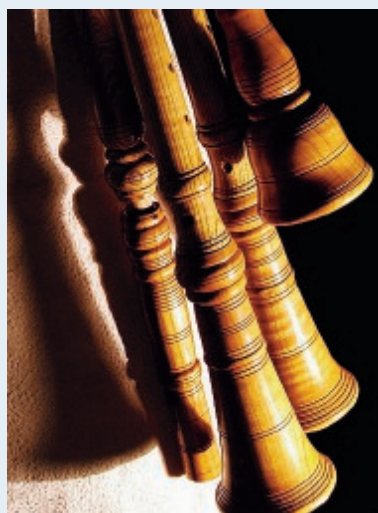
Un viaggio nella grande musica popolare

● Tornano le zampogne e le ciaramelle nel borgo di Maranola, a Gaeta, dove il 17 e il 18 novembre si terrà la XXV edizione de "La Zampogna - Festival di Musica e Cultura Tradizionale". Due giorni a tu per tu con musicisti, mastri liutai e studiosi per conoscere a fondo la tradizione e il suono di questo fondamentale strumento musicale della tradizione popolare italiana.