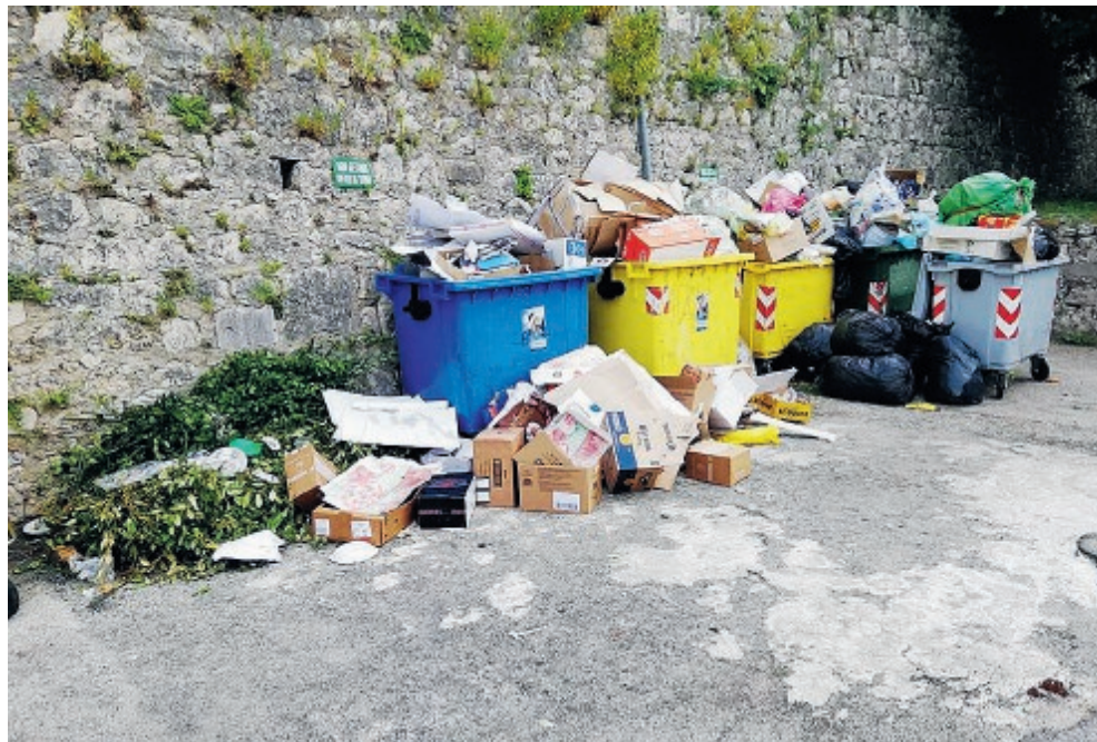
Il costo annuo pro capite dei rifiuti non scende perché molto legato alla raccolta differenziata

Per quanto negli ultimi anni ci si sia sforzati di aumentare la percentuale di raccolta differenziata con l'obiettivo di risparmiare sul costo nelle bollette dei rifiuti, i numeri diffusi dall'Ispra raccontano un'altra verità. Il costo pro capite per lo smaltimento dei rifiuti varia moltissimo e va dai circa 72 euro di Sezze ai 348 di San Felice Circeo. Sono numeri solo apparentemente datati (2016), comunque gli ultimi disponibili e pubblicati dall'Ispra. Tra il primo e l'ultimo Comune di questa particolare hit ci sono numeri assai diversi tra loro: il costo a Cisterna è di 184 euro pro capite l'anno, a Latina 202 euro, a Sabaudia 177 euro, a Sermoneta 130 euro, a Sonnino