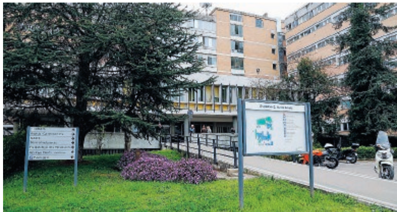
L'ospedale Santa Maria Goretti di Latina

ne in via Vitruvio, della signora, probabilmente provocata da un malore, forse un aneurisma. L'anziana venne trasportata subito al pronto soccorso dell'ospedale Dono Svizzero di Formia dove le vennero praticate le prime cure. Le venne riscontrato un trauma cranico probabilmente provocato dalla caduta. Sul referto medico venne scritto che la signora aveva riportato delle lesioni da caduta accidentale. Le sue condizioni apparvero subito gravi, venne così disposto un ricovero d'urgenza presso l'ospedale Santa Maria Goretti di Lati-