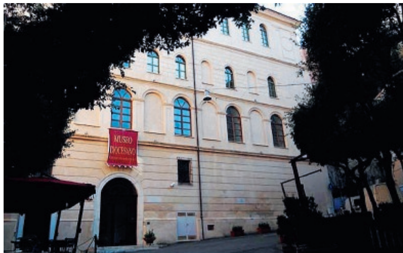
Il Museo Diocesano

■ A Gaeta dal 2 al 4 novembre si terrà un calendario di iniziative per celebrare il centenario della Prima Guerra Mondiale. Il 2 novembre ci sarà, presso la chiesa di San Nilo, alle 9.45, il raduno delle autorità civili, religiose e militari, nonché i cittadini che vogliono partecipare, per dirigersi in corteo al cimitero dove si terrà la celebrazione della Messa presieduta dall'Arcivescovo Luigi Vari, e dove, a