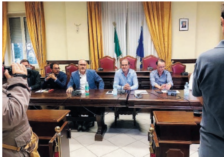
Un momento della consegna

No Pontile Petroli» ha deciso, andando oltre il commento alla notizia, di «rispondere» mantenendo alta la loro mobilitazione. I membri, infatti, si dicono pronti ad organizzare incontri con i Sindaci di tutte le cittadine della zona, contattare i Consigli di Istituto delle scuole superiori per promuovere incontri con gli studenti, lanciare progetti per la scuola primaria, nonché incontrare i cittadini senza abbandonare l'iniziativa dei banchetti informativi, come già fatto nei mesi scorsi, e la raccolta firme alla quale hanno dato vita. «L'idea - spiegano - è quella di strutturarsi come un presidio permanente che informi i cittadini e monitori la situazione del pontile, che continui a fare pressione per la dismissione o in extrema ratio la delocalizzazione offshore». ●