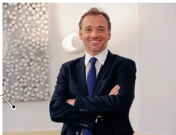
Il senatore Matteo Richetti

un'idea del senatore Matteo Richetti. La Fondazione organizza, promuove e porta avanti studi su vari temi, tutti centrali, che riguardano la vita pubblica e privata di ognuno: dall'azione amministrativa e di governo alla cultura, dalla sanità alla sicurezza, dalla finanza pubblica al diritto e alla giustizia. Per poter parlare in modo chiaro, responsabile e puntuale. Partecipa direttamente o insieme ad associazioni, enti politici e culturali, alla vita politica del paese. Muovere il dibattito, coinvolgere più persone possibili, ed intervenire con