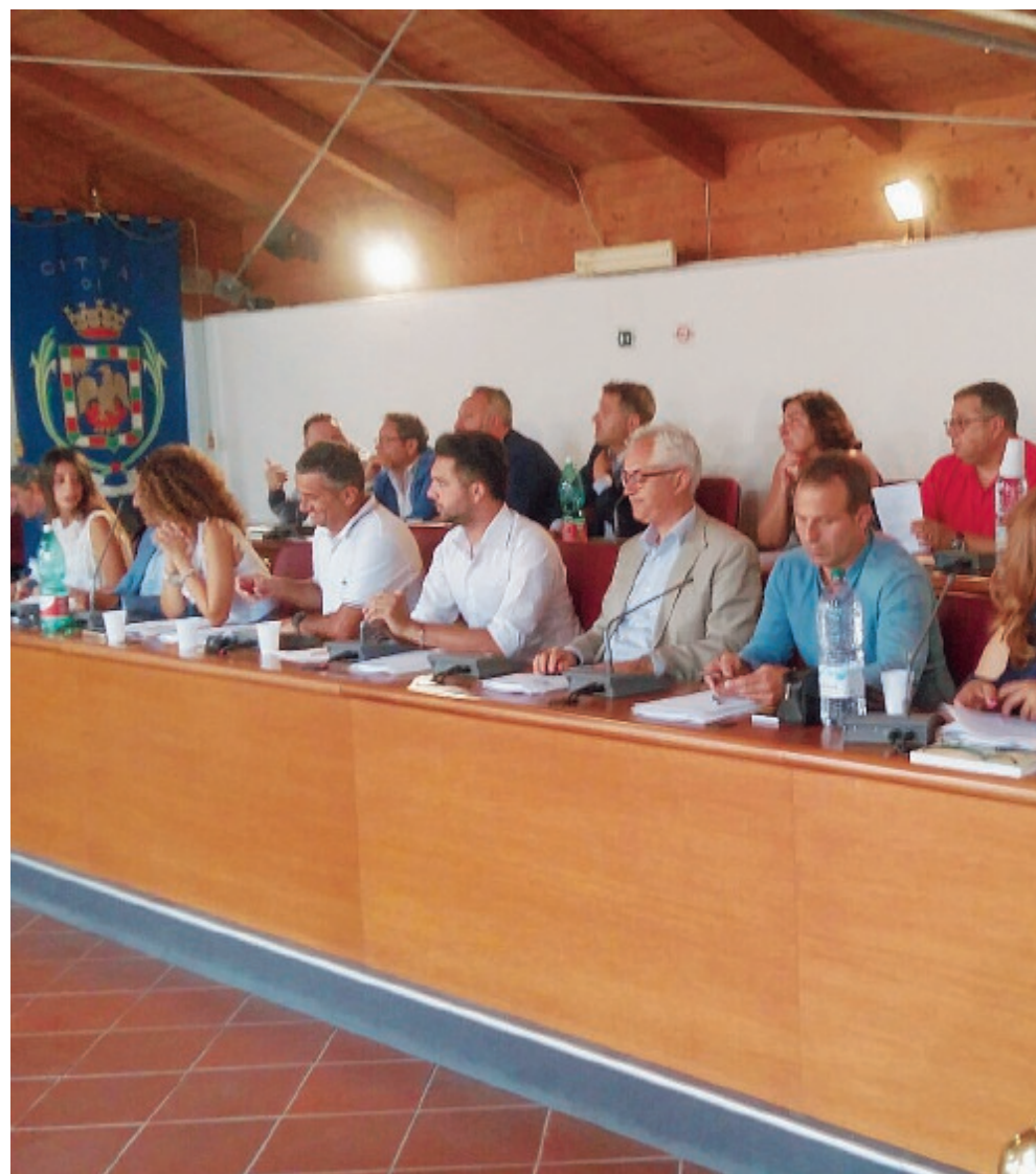
In alto il consiglio comunale di Formia

La delibera è stata oggetto di acceso scontro in Consiglio comunale