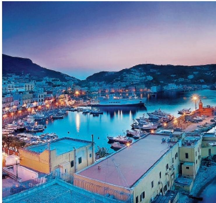
Sopra una veduta della zona Porto e a sinistra una veduta di Le Forna, entrambe zone che ricadranno del Piano Particolareggiato dei centri storici

di operare esclusivamente sul versante del consolidamento e delle condizioni qualitative del patrimonio edilizio esistente, sulla rivitalizzazione e innesto di funzioni sociali ed economiche, sull'inserimento e razionalizzazione degli spazi di relazione e sul reperimento di possibili standard urbanistici. Per il raggiungimento delle