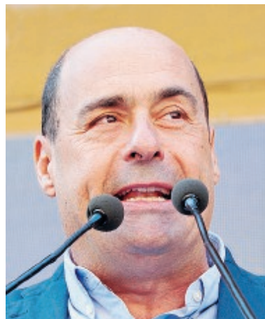
Il presidente Nicola Zingaretti