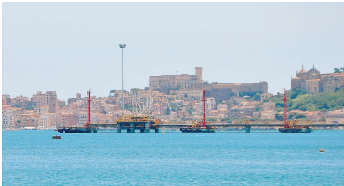
Il pontile petroli