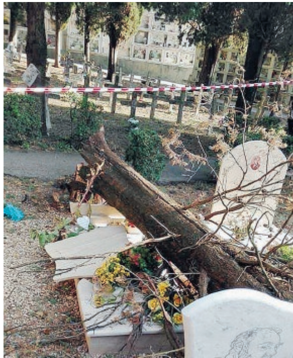
L'albero caduto sulle tombe

Una brutta sorpresa anche per coloro che si sono recati a trovare i loro cari defunti ed hanno trovato le tombe devastate e la zona delimitata. Subito è stato puntato il dito