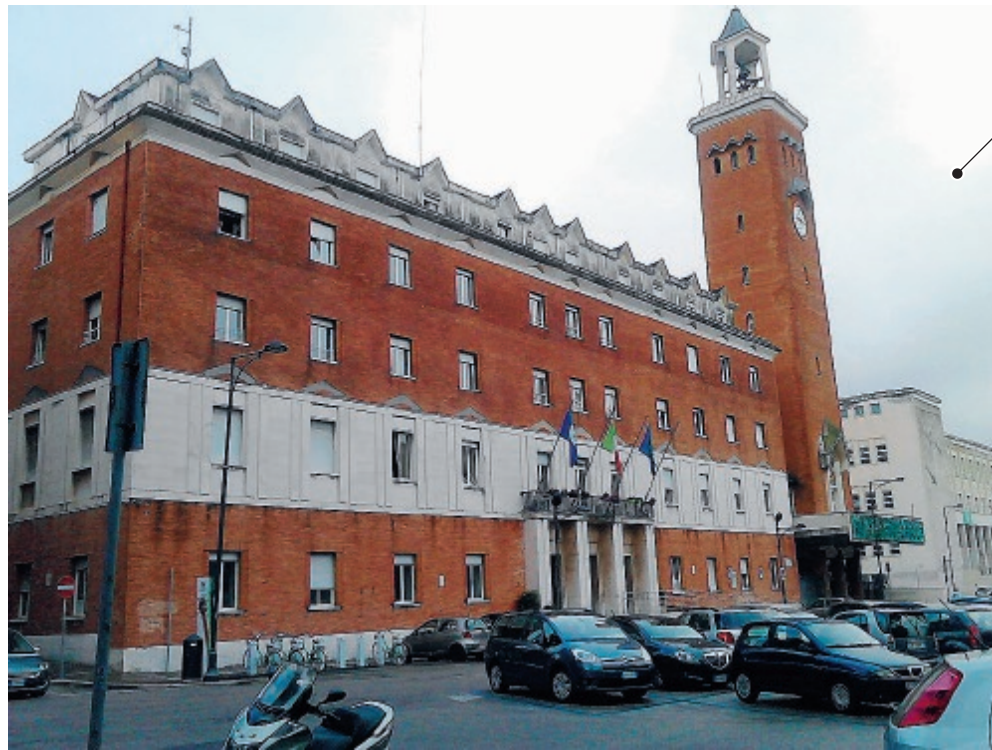
Il palazzo comunale di Gaeta

Il caso L'ente dovrà sborsare oltre centomila euro per terreni che aveva sottratto per scopi di pubblica utilità a dei cittadini. La Corte d'Appello di Roma aveva dato definitivamente ragione ai proprietari dei lotti ma non si erano mai visti liquidare