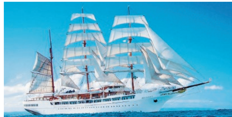
La nave da crociera "Sea Cloud II"

le unità dell'equipaggio. L'arrivo da Napoli è previsto intorno alle sette, quando i turisti potranno scegliere di scendere in città e visitarla o muoversi nelle altre città del Golfo di Gaeta, fino al momento della ripartenza alla volta del porto di Civitavecchia, prevista intorno alle diciassette. La "Sea Cloud II" è l'ennesima nave che giunge nel mare del Golfo, a conclusione definita della quale nel tentativo di tracciare bilanci più completi, parlando di quello legato al turismo crocieristico a Gaeta sembra essere positivo. ● Adf