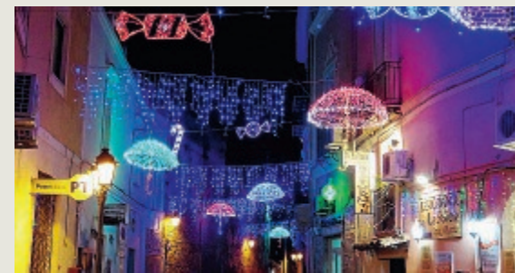
Le Luminarie di Gaeta dello scorso anno

bambini a scuola. Il parcheggio adiacente alla scuola elementare Virgilio in piazza XXIV maggio, infatti, sarà occupato per quattro mesi dalla pista di pattinaggio e altre decorazioni. «Con due bambine da accompagnare a scuola, di cui la più piccola nel passeggino e l'altra per mano, faccio una gran fatica - ha dichiarato una delle tante madri coinvolte nel disagio - trovare il parcheggio è un'impresa e non oso immaginare nei giorni di pioggia. Tralasciando il fatto poi che il Virgilio non ha un ingresso accessibile ai passeggini ed è piuttosto difficile portarlo a braccio fin su». Alcuni genitori, per ovviare alla scarsità di servizi, hanno proposto l'utilizzo di pulmini: «Magari, per portare i bambini a scuola, ci si potrebbe organizzare con dei pulmini visto la futura mancanza di posti auto». ●