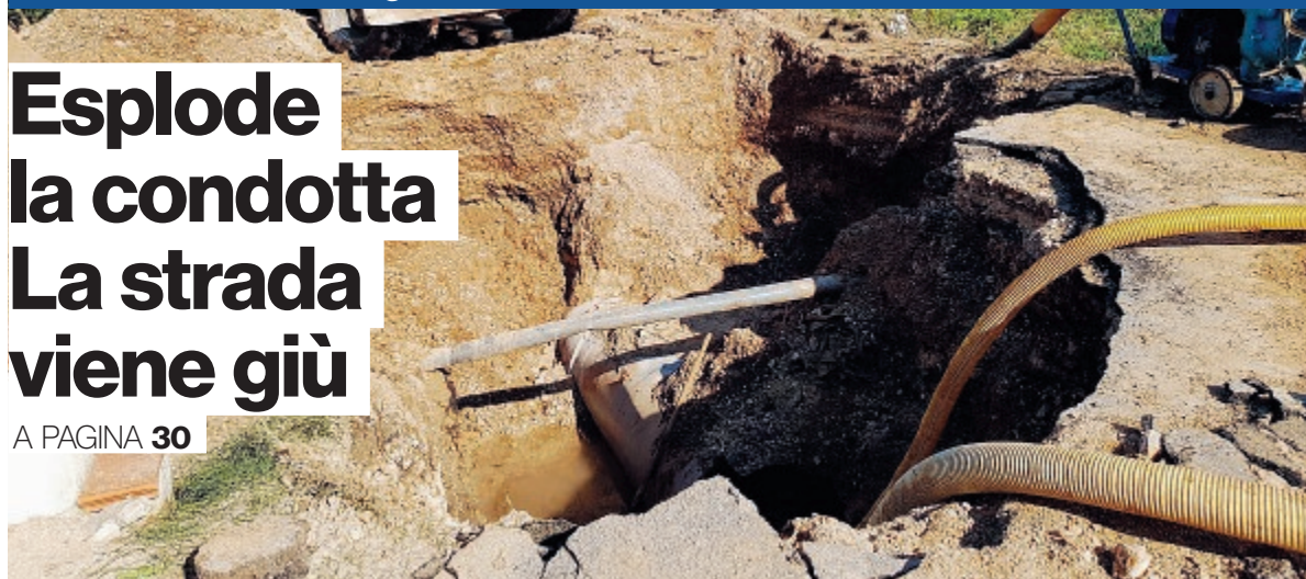
La voragine che si è aperta su via della Rinchiusa