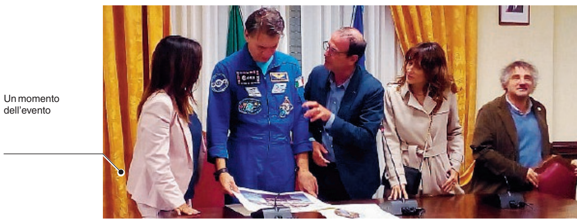
Un momento dell'evento

popolari che amministra di comune accordo la nostra città, devono ormai esplorare distanze astronomiche per riuscire a strappare un applauso spontaneo. Ciò è ancor più evidente se si pensa che, perfino in uno dei pochi universi berlusconiani residui quali il nostro, queste persone sono costrette a presentarsi con pochissimo preavviso e scarsa pubblicizzazione, temendo forse polemiche o contestazioni ed imponendo la loro retorica ad un pubblico di minorenni costretti ad ascoltarli». ● Adf