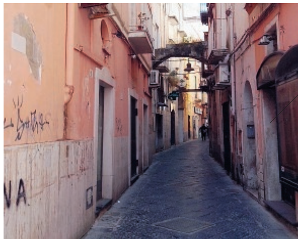
Via Indipendenza a Gaeta