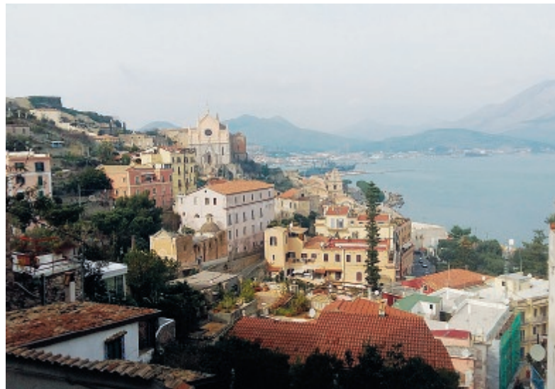
Una veduta di Gaeta

Non verrà trascurato, secondo quanto deliberato, neanche l'arredo urbano con l'inserimento, ad esempio, di panchine, aiuole, muretti e tutto ciò che si riterrà necessario per riqualificare l'intera area. ● Adf