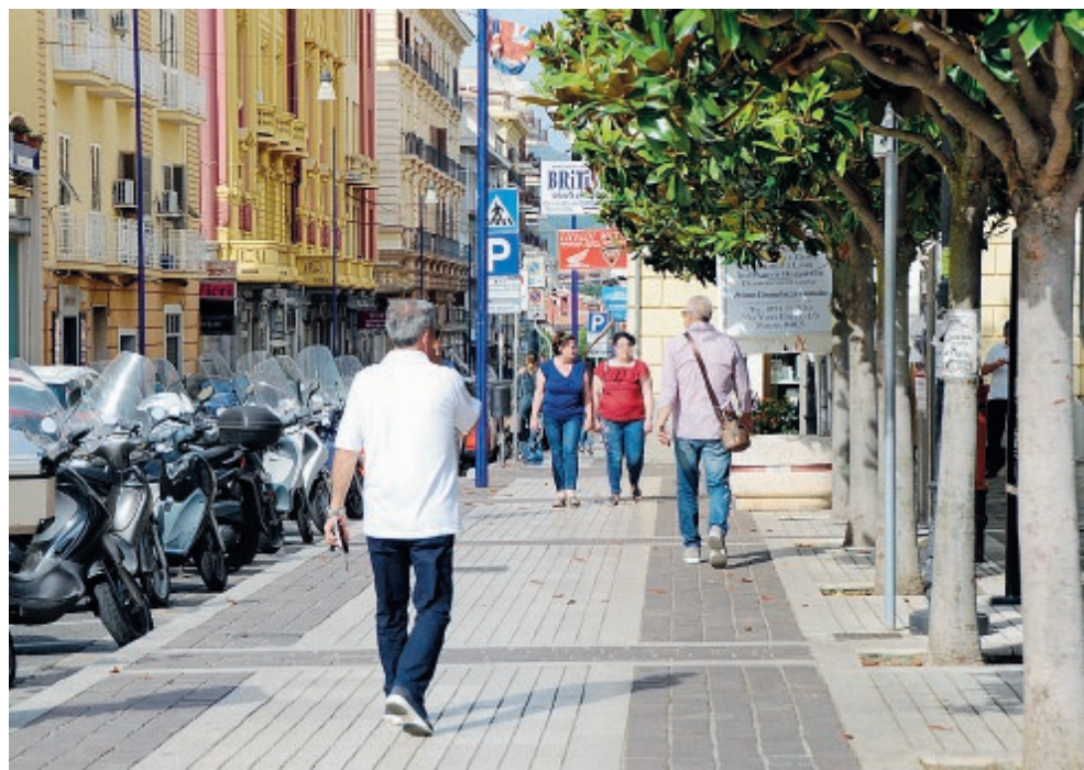
Fioccano le critiche sulla gestione dei parcheggi e sulla mensa scolastica