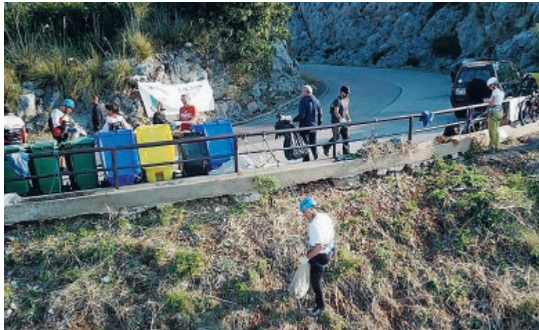
Un momento della bonifica dei climbers

l'area, depositando i contenitori di diverso tipo lungo il guardrail e calandosi poi con le corde lungo il costone di roccia, caratteristica sosta per ammirare il panorama ma anche luogo in cui si gettano i rifiuti con una eccessiva facilità. L'immondizia è stata raccolta dagli anfratti più scomodi grazie ai climbers che a turno si sono calati per raccoglierceli. Insieme a loro i bikers e gli operatori della ditta dei rifiuti, che hanno poi portato via i contenitori carichi di rifiuti. Una giornata dedicata all'ambiente, sfruttata anche per stare in compagnia e condividere la buona pratica di vivere una passione sportiva e al contempo