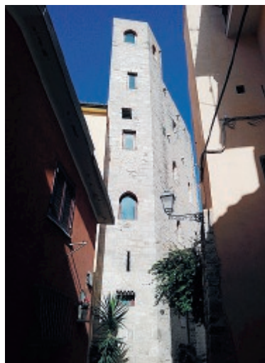
Sopra, palazzo Braschi; a sinistra prima l'ex chiesa di San Domenico, poi la casa Torre degli Acso. Tutti hanno visto un tentativo di gestione andato a vuoto