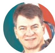
Paolo Nespoli astronauta ESA ospite a Gaeta