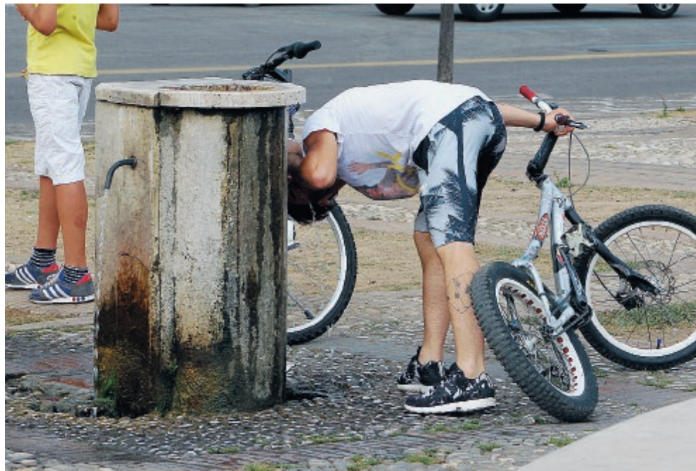
Secondo le previsioni da oggi l'abbassamento delle temperature, ma l'autunno è iniziato ufficialmente il 21 settembre

Un evento che non è passato inosservato, visto che un caldo così ad ottobre si è visto poche volte. Certo, siamo lontani dalle preoccupazioni dello scioglimento dei ghiacciai o dei tornado che spazzano via intere città, ma il fenomeno è arrivato ovunque, anche a Latina: stiamo trascurando il ri-