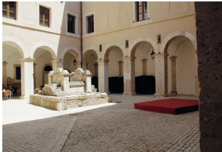
Il palazzo Caetani di Cisterna di Latina

questa giornata di apertura sono solo l'inizio del percorso che porteremo avanti. Vogliamo organizzare nuove occasioni di visita e scoperta e ripetere ogni anno questa apertura straordinaria per dare la possibilità a sempre più persone di ammirare la grande bellezza di questi luoghi. Già nei prossimi mesi amplieremo anche la Rete delle Dimore Storiche con un bando che aprirà i termini per far aderire nuove dimore».