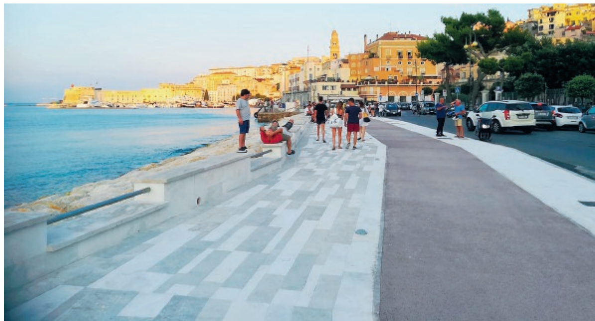
Il tratto del lungomare Caboto già recuperato