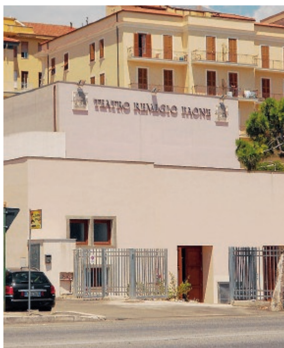
Il teatro Remigio Paone di Formia; la scheda per votare

Al via la sottoscrizione popolare a premi di beneficenza «Premio Remigio Paone». Sono anche altre le attività che ruotano intorno a questa II edizione del Premio Remigio Paone, non in ultimo una lotteria. Più precisamente una sottoscrizione popolare a premi che consegnerà al quinto estratto un casco integrale messo in palio dalla Sasso Group; al quarto estratto una stampante Samsung offerta dalla Macrobyte 2.0; al terzo estratto un profumo unisex Acqua di Parma, una borsa e un borsellino Mugler offerto da Ambra e Miele; al secondo estratto un Cofanetto Boscolo History e Fashion dal valore di 500 euro che contiene una mini vacanza per tre giorni e due notti valido per due persone in