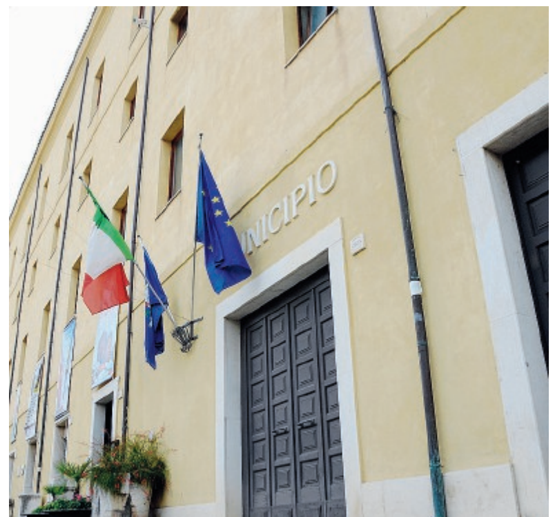
Il palazzo comunale di Formia; una veduta della città

la mia crescita professionale e spesso anche alla mia famiglia». «Ecco, noi per curiosità abbiamo deciso di andare a vedere sull'Albo Pretorio cosa ha prodotto l'Assessore e il quadro, nostro malgrado, è stato a dir poco desolante. Se dal punto di vista del turismo Formia