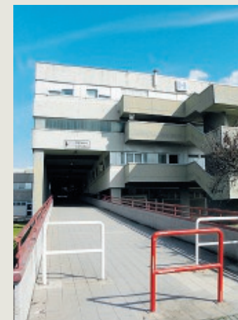
L'ospedale di Terracina