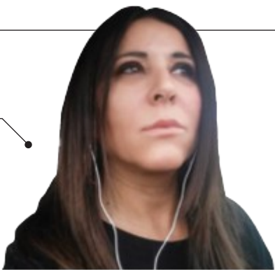
Marinella Pacifico Senatrice M5S