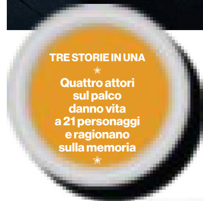
Sopra l'affiatato cast dello spettacolo "Incognito"

pochi minuti, rimanendo coscienti soltanto del suo amore per la moglie. La terza storia riguarda Martha, una neuropsicologa che si interroga su chi sia più fortunato: la gente "normale" che non riesce a dimenticare certe cose, oppure i suoi pazienti affetti da amnesia che dimenticano anche rancori e ferite. Info: 066784380.