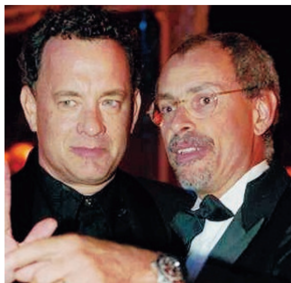
Nella foto a sinistra Angelo Maggi è con Tom Hanks. Nella foto a destra il teatro Belli di Roma.

Al "Belli" il primo spettacolo dedicato all'arte del doppiaggio