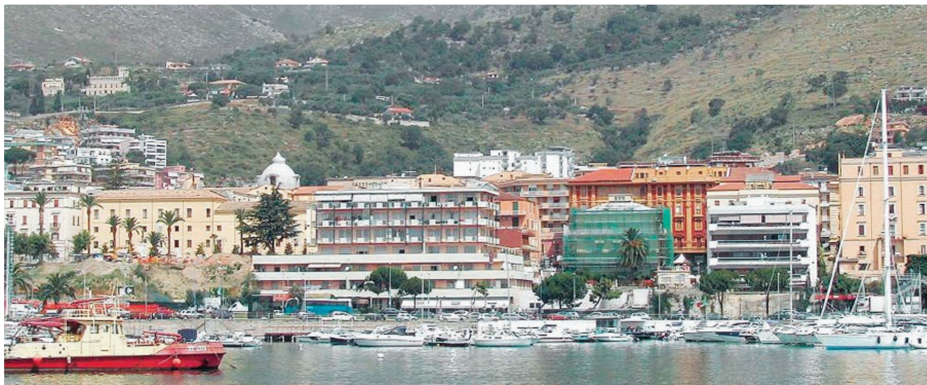
Panoramica di Formia, dove il prossimo 10 giugno si andrà al voto per il rinnovo del Consiglio comunale