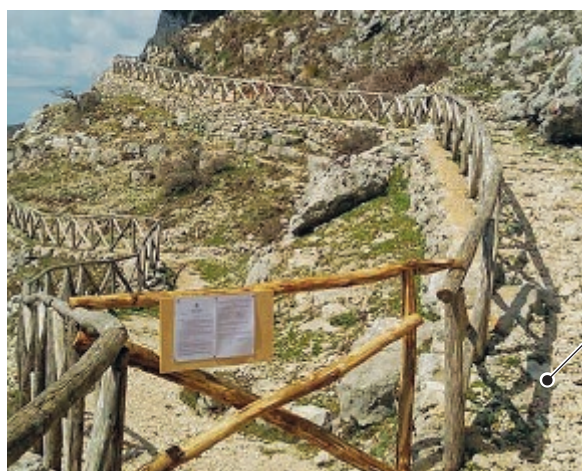
Il sentiero di San Michele sul Monte Redentore ora chiuso