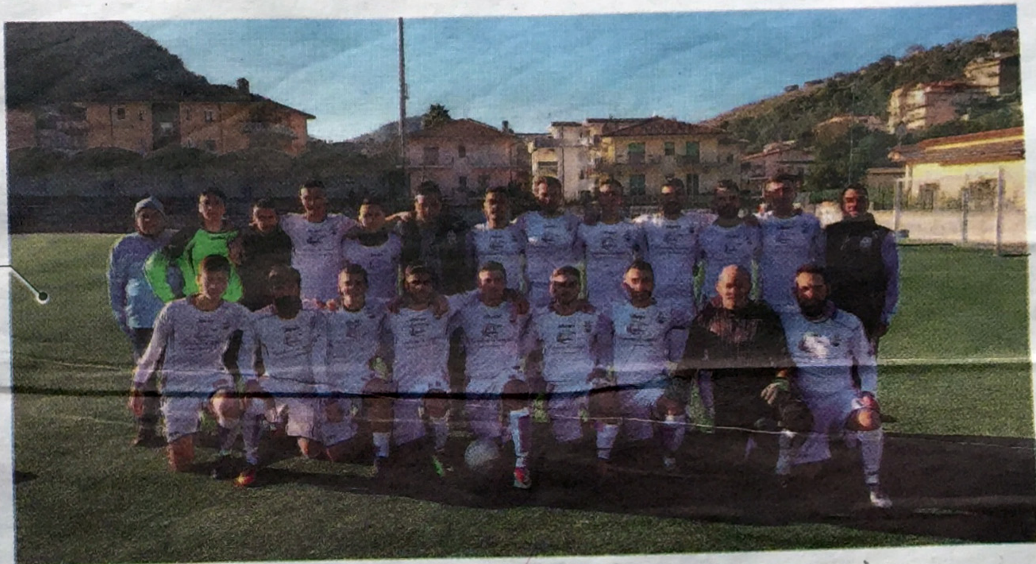
La formazione dell'Atletico Itri ieri vittoriosa con un pesante 11-0 che gli ha permesso di finire il torneo sul podio

Il Boca Itri vince in esterna e stacca il biglietto per il quarto posto