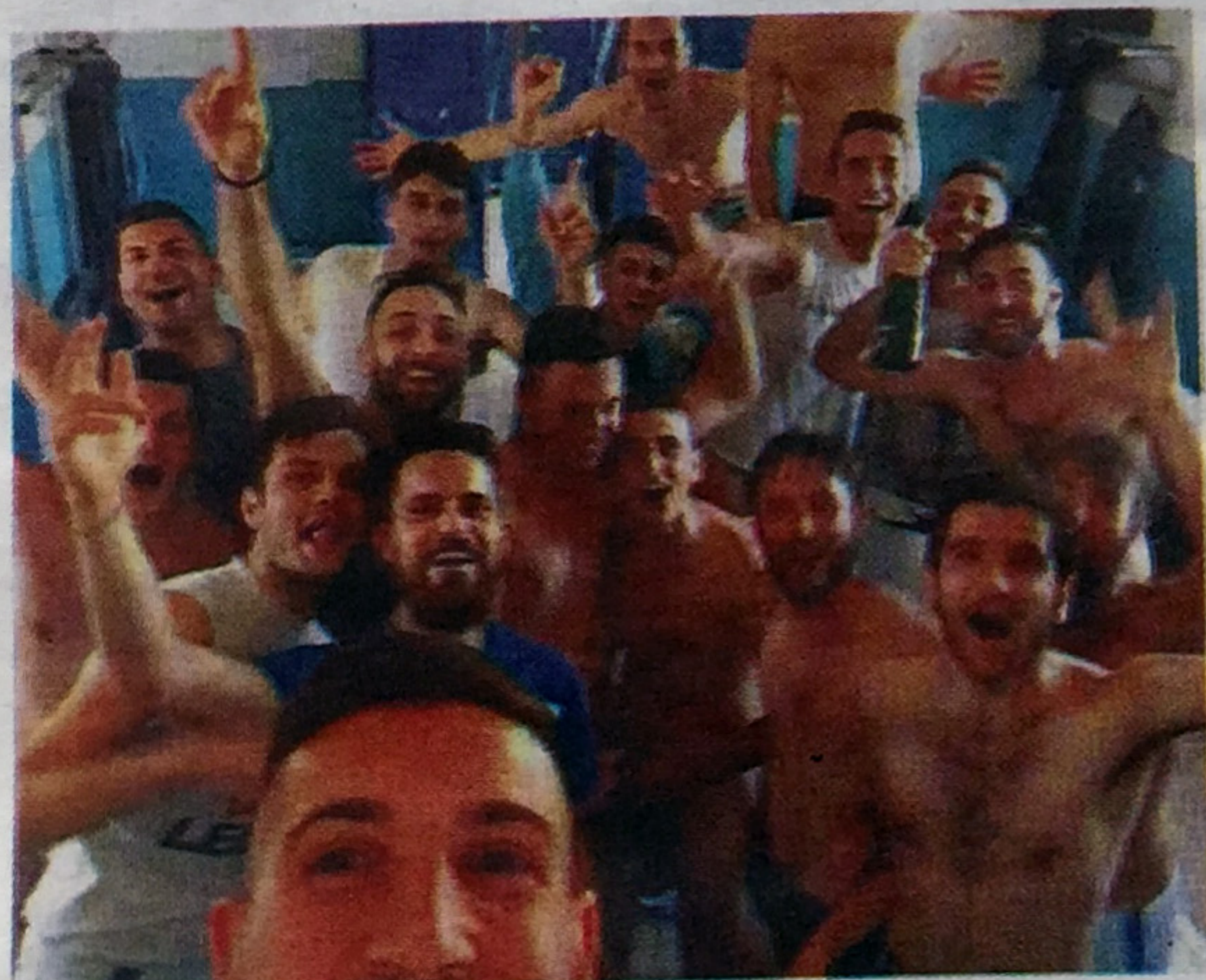
Il selfie degli itrani