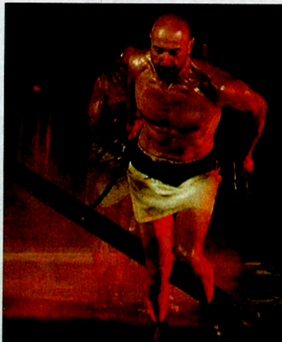
A destra, a sinistra e in alto alcuni momenti della scorsa Passione di Cristo di Sezze