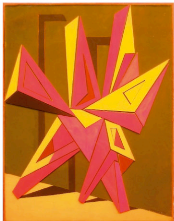
Omaggio a De Chirico, tecnica mista (filtro arancio), 1975