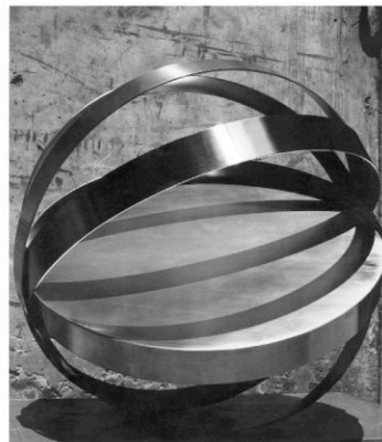
Sfera, acciaio inox, 1968