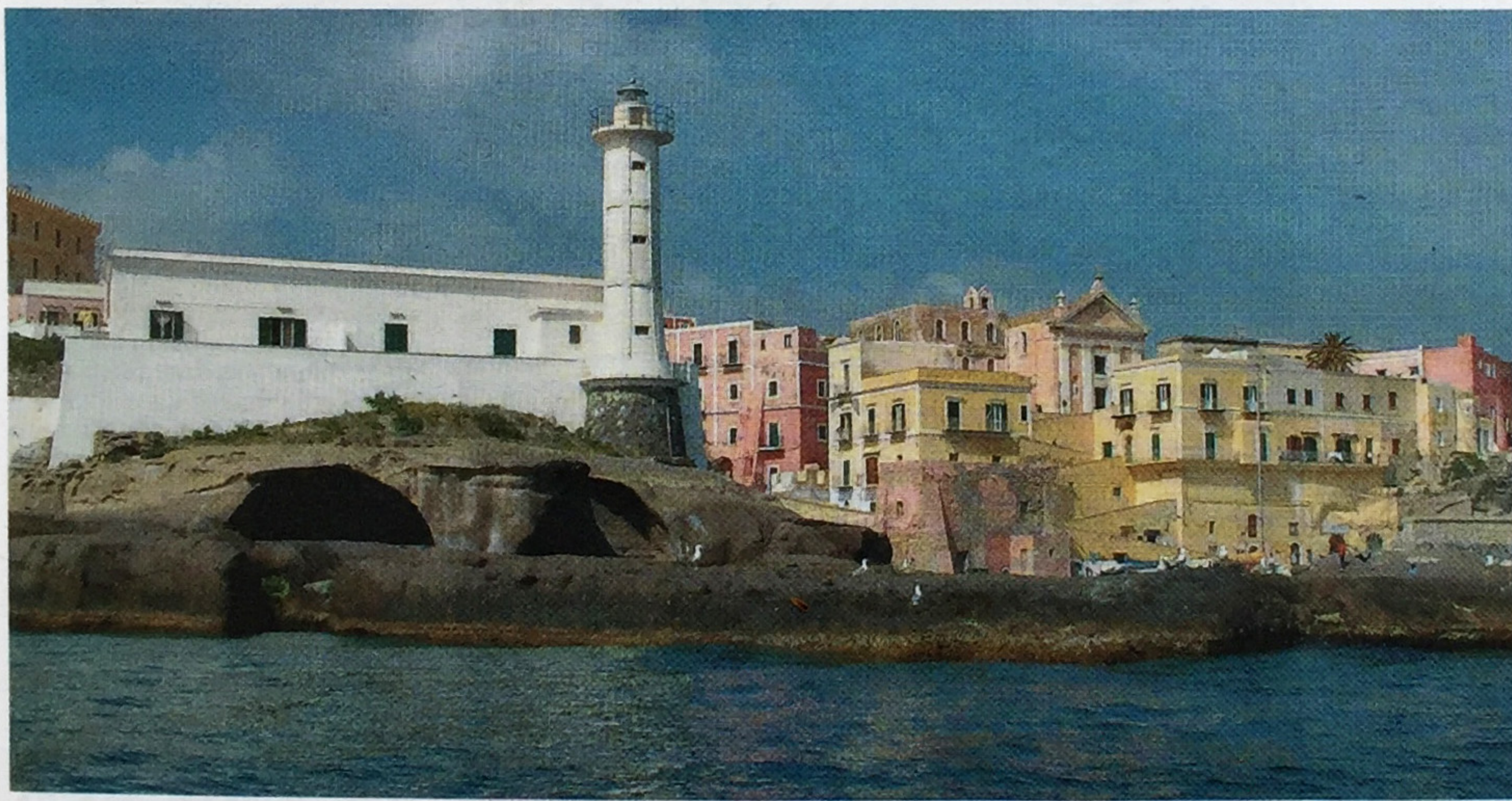
Una veduta di Ventotene