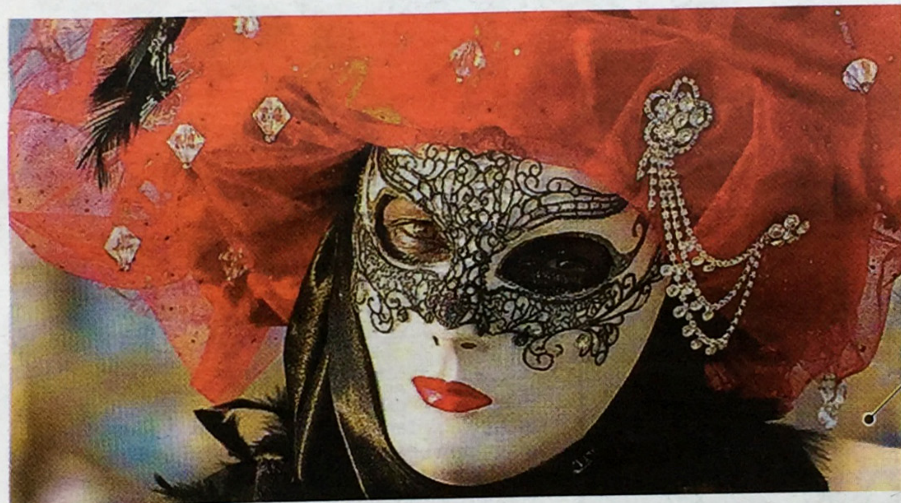
Mascherine protagoniste Tante proposte e iniziative a Formia e Gaeta

Marina di Serapo fino a Piazzale Caboto, che dalle ore 14.30 sarà il fulcro della festa: gruppi danzanti, momenti di intrattenimento ed esposizione dei carri allegorici. Sempre oggi, dalle ore 19, l'Associazione Culturale OpenSpace - La Compagnia delle Nuvole animerà i vicoli aragonesi del Centro Storico di Gaeta Medievale con la manifestazione