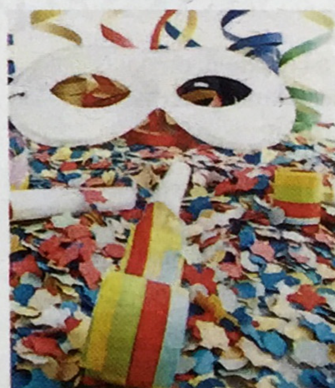
Mascherine e coriandoli: è Carnevale