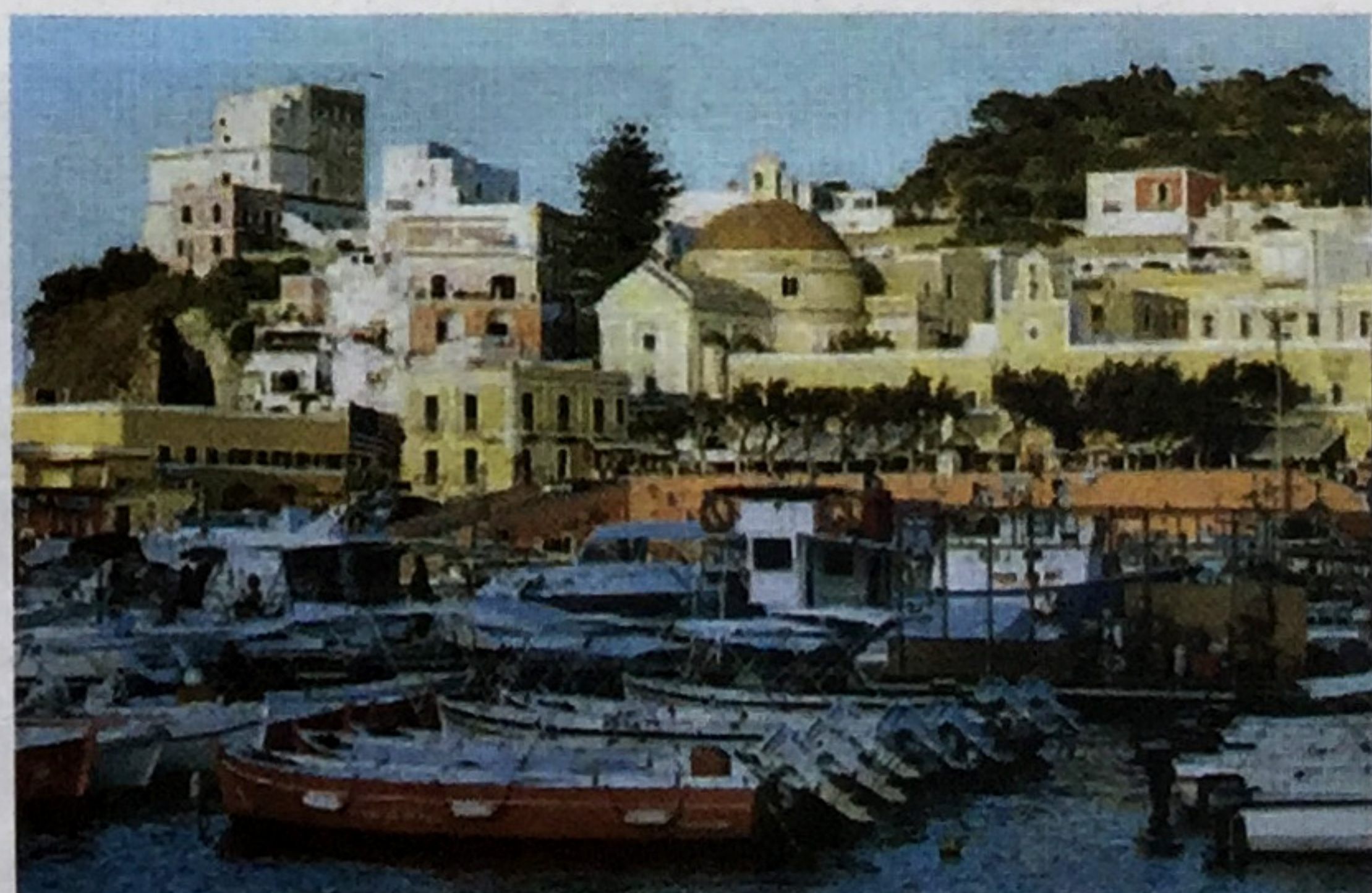
Una veduta di Ponza

Ha contestato che dall'ultima lettura dei contatori (luglio-agosto 2015, quando si è chiusa la gestione comunale ed è entrata Acqualatina) non era-