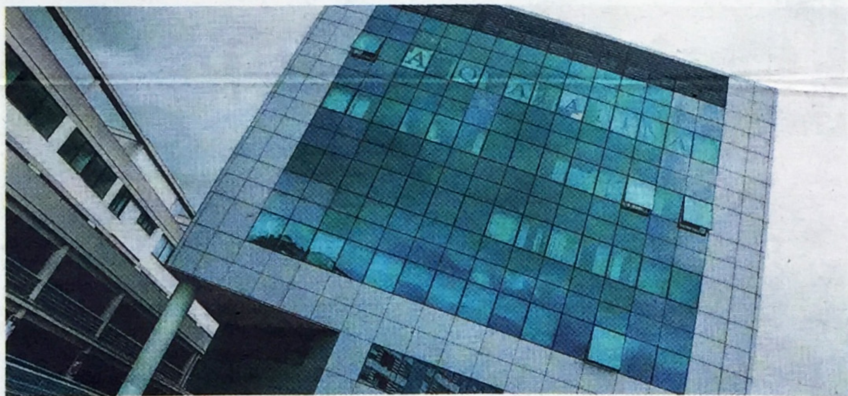
La sede della società Acqualatina che si trova all'interno del complesso Latinafiori