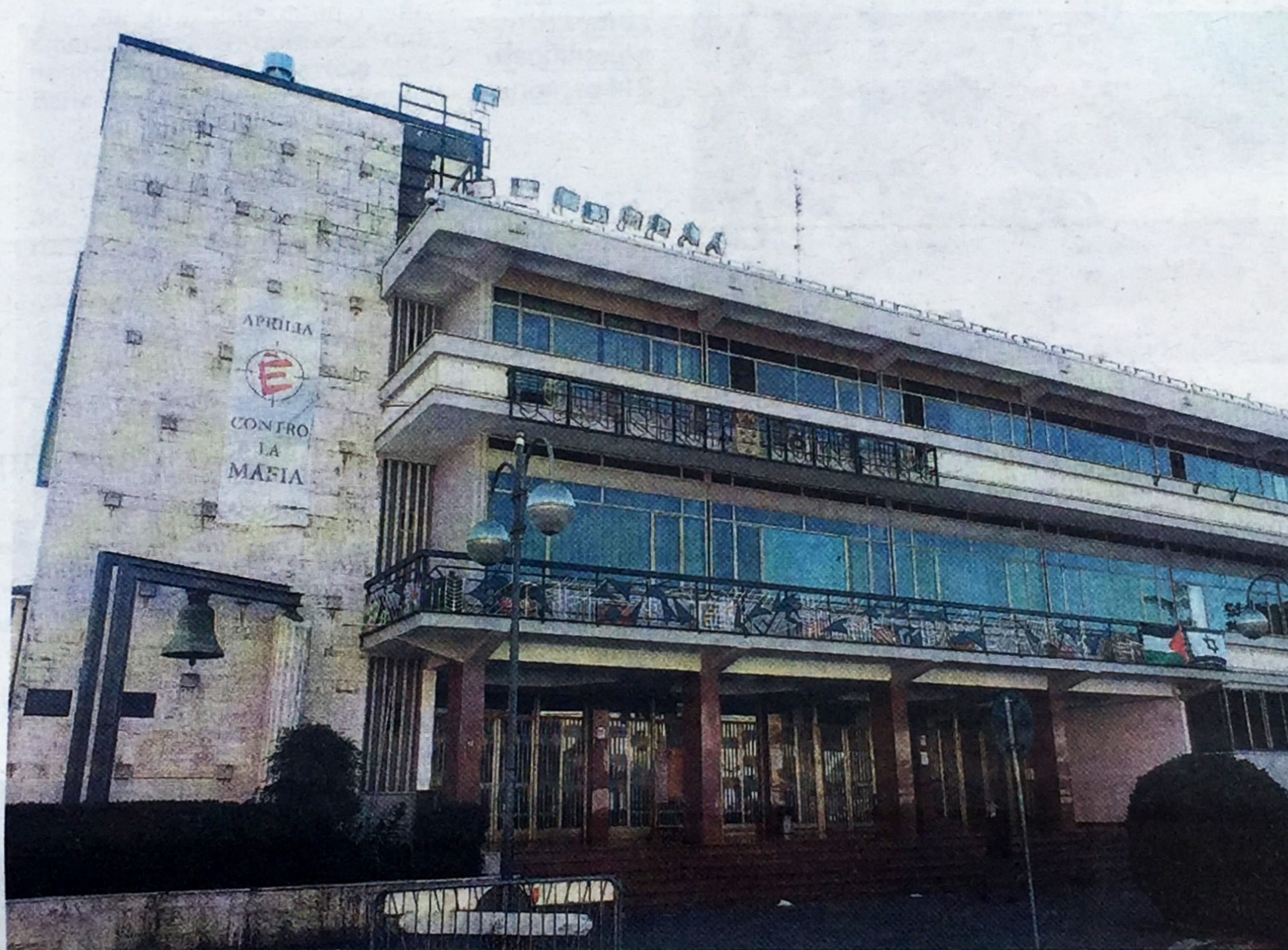
La sede del Comune di Aprilia che da anni porta avanti una dura battaglia contro il gestore del servizio idrico

La sentenza non entra nel merito della vicenda, anche se di fatto conferma la giurisdizione