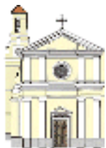
S. Carlo Borromeo