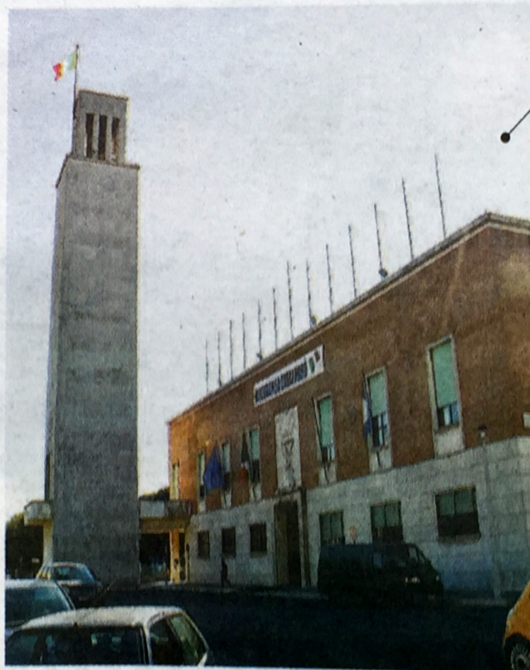
Il Comune di Sabaudia

«Nei giorni scorsi, l'istituto di credito irlandese ha annunciato di essere pronto a far valere le proprie prerogative qualora non si arrivasse all'approvazione del bilancio di "Acqualatina" alla prossima assemblea. Tra queste - spiegano da "Cittadini al Lavoro" - c'è la possibilità in cui "Depfa" potrebbe sostituirsi agli enti che hanno dato le quote in pegno. Alla luce di questo e considerato che l'istituto del pegno su azioni non è contemplato tra le decisioni che l'ente locale può assumere secondo la legislazione vigente in materia, Gervasi esorta l'intervento del commissario affinché, verificata la correttezza o meno dei procedimenti amministrativi