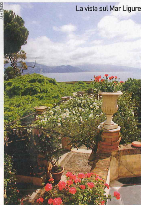
La vista sul Mar Ligure

■ Il giardino è aperto al pubblico solo per appuntamento: tel. 360 352510, www.giardinoponza.it