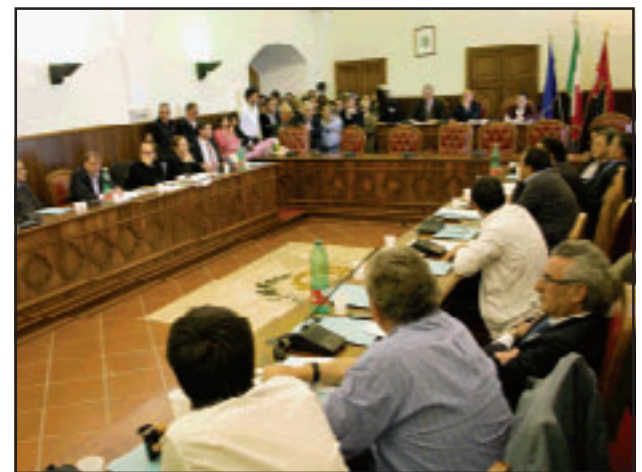
CONSIGLIO COMUNALE MINTURNO

fissati tutti per lunedì pomeriggio con Spigno che inizierà alle 17,30, mentre gli altri tre consigli si raduneranno alle 19. Il Consiglio delle autonomie locali, istituito presso il Consiglio Regionale nel 2007, è un organo di rappresentanza, consultazione e raccordo tra gli enti locali e la regione, al fine di garantire il rispetto dei principi costituzionali e statutari di sussidiarietà, di differenziazione e di adeguatezza e l'effettiva