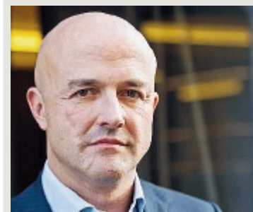
Gianluigi Nuzzi il 25 giugno