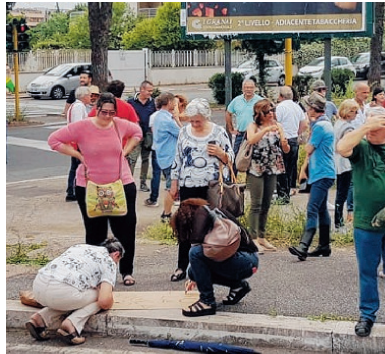
Terra: «Non possiamo sobbarcarci altri rifiuti» Porcelli: «Progetto insostenibile»