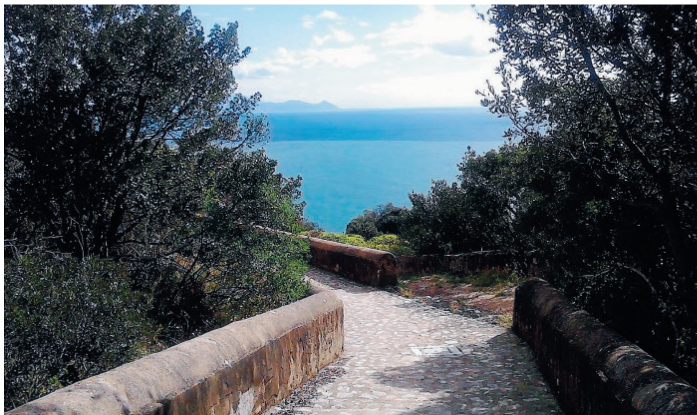
Uno dei luoghi suggestivi del Parco Riviera di Ulisse

Ambiente Atti in Regione e possibile ricorso al Tar dopo la nomina dei delegati al consiglio