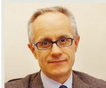
Luciano Fontana il 13 luglio