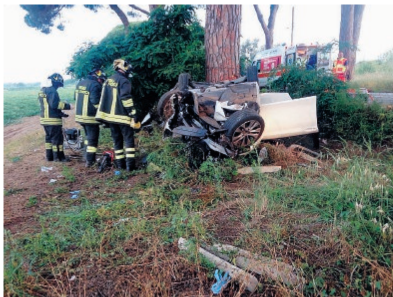
I primi soccorsi prestati dopo l'incidente di domenica scorsa in zona Acciarella

Per uno dei ragazzi è stata sciolta la prognosi Il conducente negativo al test alcolemico