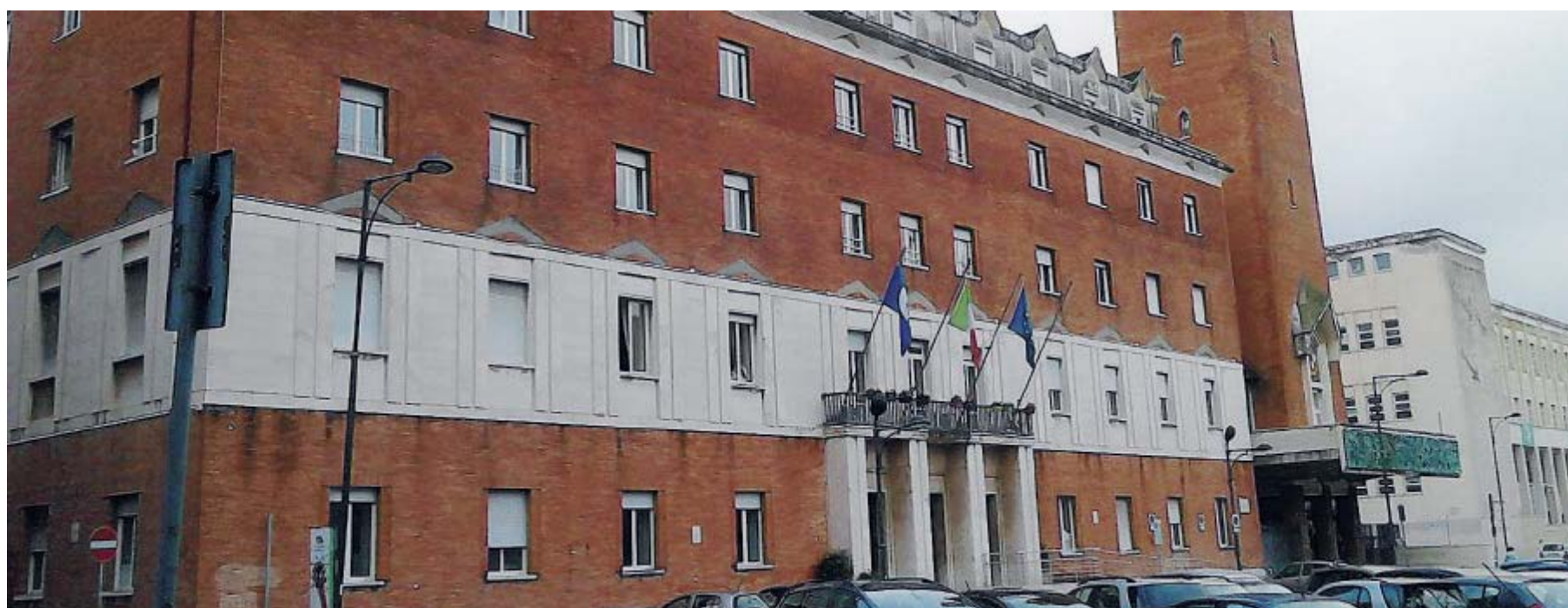
Il palazzo comunale di Gaeta