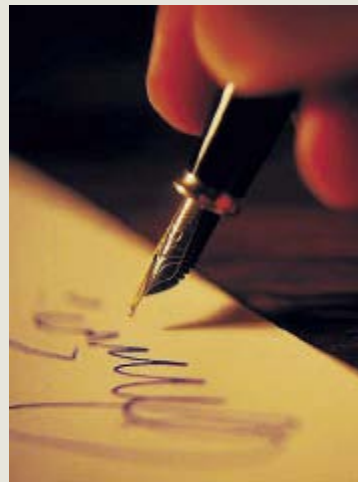
L'arte di scrivere poesie

Un premio di poesia rivolto ai giovani di ogni nazione. Giunto alla terza edizione, c'è tempo fino alla fine di febbraio per partecipare: il bando è stato pubblicato sul sito www.associazionepepella.com . E' dedicato a Masio Lauretti, medico apriliano scomparso nel 2001, molto attento alle tematiche giovanili. La premiazione dei vincitori avverrà nel mese di maggio ad Aprilia. Questa la giuria: Beppe Costa, poeta e scrittore, Giada Lauretti, neuropsichiatra, Antonella Rizzo, poetessa e scrittrice e Francesca Barbalisca, assessore alla Pubblica