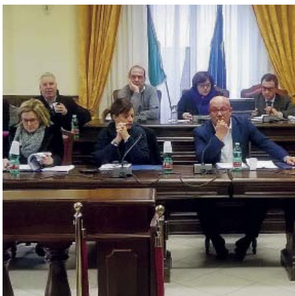
Il consiglio comunale di Gaeta

Tra gli obiettivi del nuovo piano regolatore la rigenerazione dello stabilimento dell'ex Avir e dell'area Eni