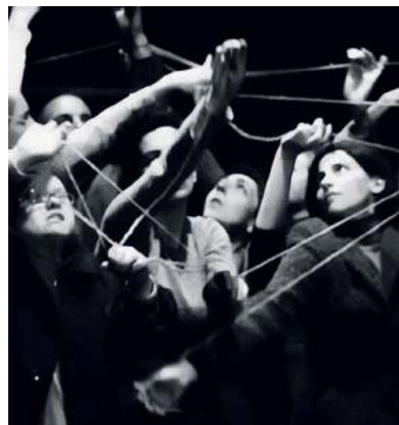
Sopra una foto di scena da "Le voci del tempo" di Opera Prima Sotto l'opera "Arrival of a Convoy" di David Olère

Dove andare Tutte le iniziative in programma nella provincia pontina Il viaggio di Francesca Ulisse: "Un'immersione nella sofferenza di allora"