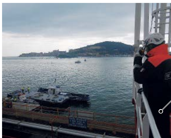
Un momento dell'operazione nel golfo di Gaeta

■ Un'esercitazione antinquinamento, denominata “Pollex 2018”, presso il Pontile Petroli del porto di Gaeta. L'esercitazione, organizzata dalla guardia costiera di Gaeta, ha avuto lo scopo di testare la macchina organizzativa ed operativa che è quotidianamente predisposta per contrastare eventuali inquinamenti causati dallo sver-