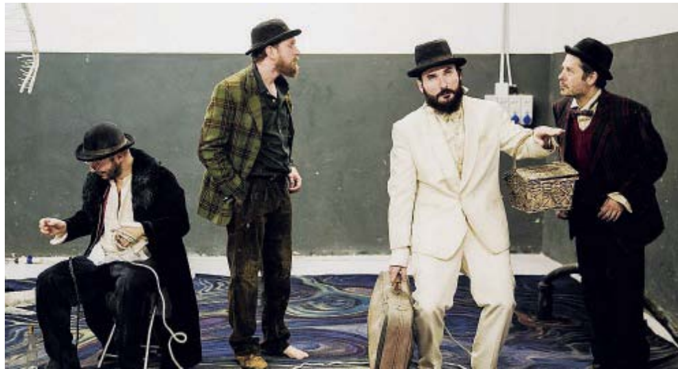
In alto una scena da "I Love Frankenstein" Accanto "Aspettando Godot"

Per informazioni e prenotazioni: info@matutateatro.it oppure telefonare al 328.6115020. ●