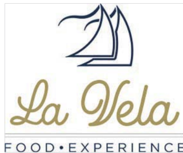
Nelle foto gli interni e il logo del Ristorante "La Vela", situato al piano terra dell'Hotel Miramare

Una "food experience" che racconta il territorio E d'estate apre anche il Bistrot