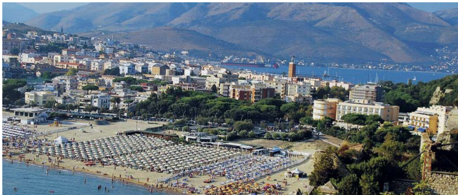
Una veduta di Gaeta

la propria abitazione. A seguito di una perquisizione domiciliare l'uomo veniva trovato in possesso di liquido infiammabile, che veniva successivamente sottoposto a sequestro penale. A Scauri invece i carabinieri a conclusione di specifica attività d'indagine, hanno deferito in stato di libertà un 37enne. L'uomo durante la notte tra il 17 e 18 gennaio, dopo aver forzato la serranda e la successiva porta d'ingresso, si introduceva all'interno di una attività commerciale sita sul lungomare di Scauri, asportando la somma di euro 80 circa custodita nella cassa. L'uomo è stato riconosciuto grazie alle immagini estrapolate dall'impianto di video sorveglianza. ●