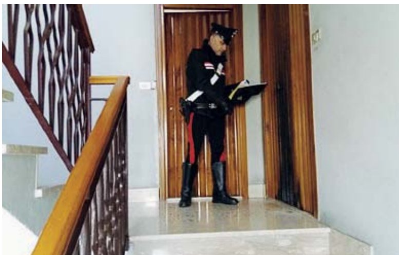
I carabinieri sul luogo dell'incendio

Le immediate indagini nonché la testimonianza della denunciante permettevano di identificare il responsabile di tale gesto, il quale opponeva resistenza ai militari operanti non aprendo la porta del-