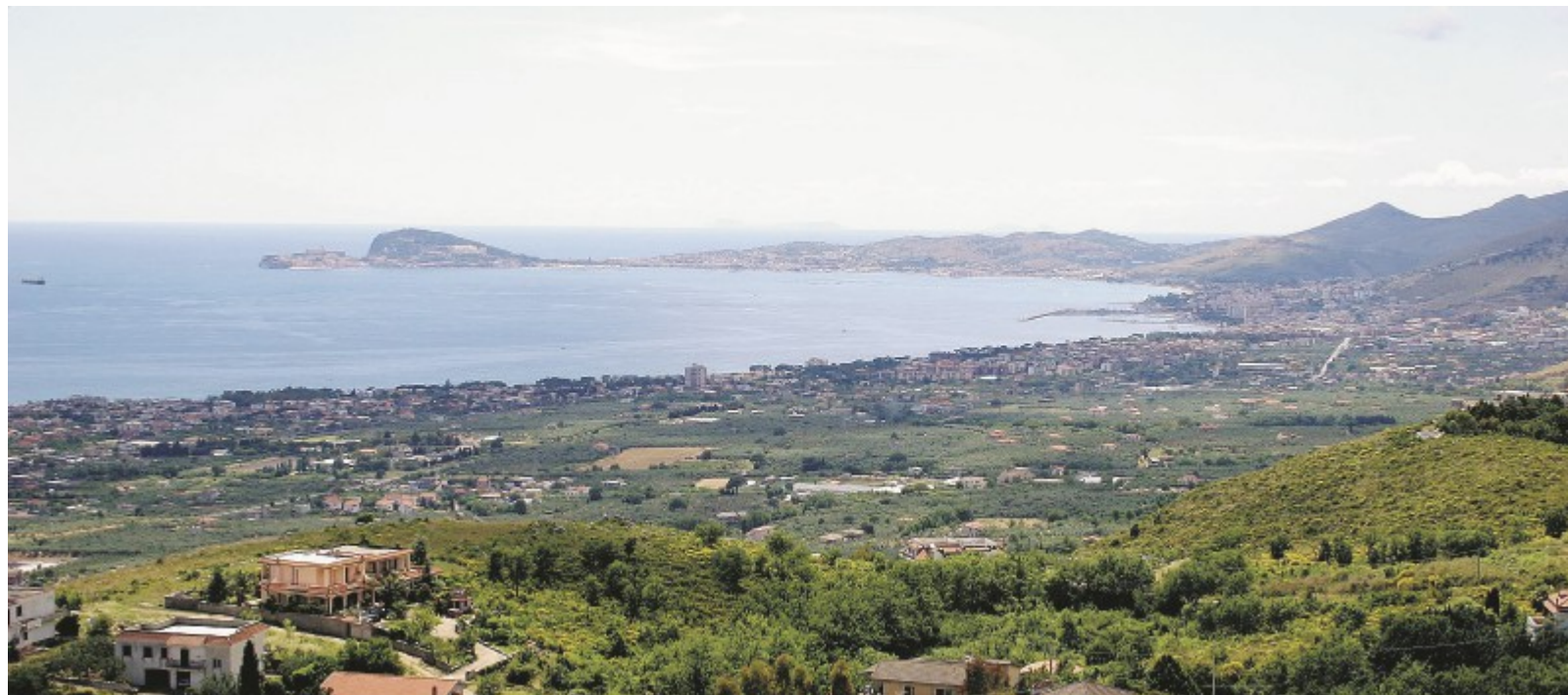
Una veduta del golfo di Gaeta; una nave cisterna

Il caso Gli isolani sono preoccupati per le sorti della stagione estiva. Idea Domani attacca la società